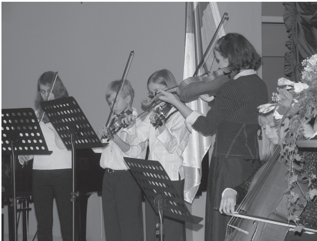
Musiikkiopiston oppilaita esiintymässä viime vuonna kunnan itsenäisyysjuhlassa.

Taiteen perusopetuksen musiikin laaja oppimäärä on kunnioitettavan iso paketti. Opetusta annetaan musiikin perustason todistukseen 665 tuntia. Sen jälkeen oppilaalla on mahdollisuus jatkaa musiikkiopistotasolle, joka on laajuudel-