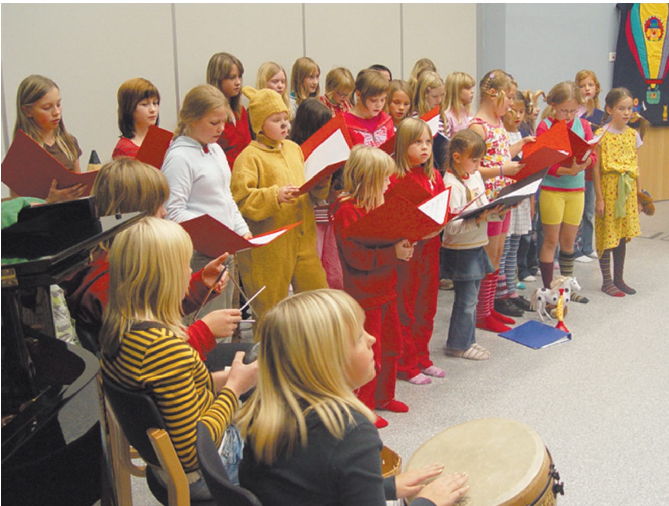
Kirkonkylän koulun kuoro esitti satuaiheisia lauluja; juhlayleisö näki muun muassa tanssahtelevan Nalle Puhin.