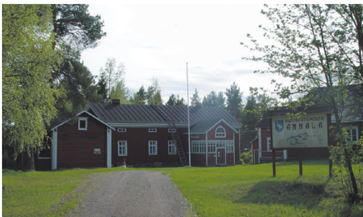
Annalan kotiseutumuseo on valtakunnallisesti merkittävä museokohde. Vaikka Annalan museo on ennen muuta museo, siellä järjestetään muitakin tapahtumia, kuten lausuntailtoja, kotiseutujuhlat, kesäteatteria ja joulukuusenhaun MM-kisat.

Alkuperäisellä paikallaan olevat Annalan rakennukset on luokiteltu hyvin arvokkaiksi.