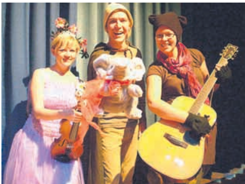
Elegantti Elefantti konsertoi Pyhäjoen kouluilla keskiviikkona 9. huhtikuuta

Koulukonserteissa omalla koululla lapset pääsevät usein ensimmäiseen kosketukseen ammattilaisten esittämän taiteen kanssa ja saavat ehkä itselleen potkua uuteen harrastukseen taide-elämyksen lisäksi. Koulukonserteissa palvelu tuodaan asiakkaan eli lapsen luo, eikä lasten matkoihin kulu aikaa eikä rahaa. Koulut eivät pysty yksin koulukonsertteja järjestämään, vaan yhteistyökumppaneita tarvitaan mm. kunnan kulttuuritoimesta ja Konserttikeskuksesta.