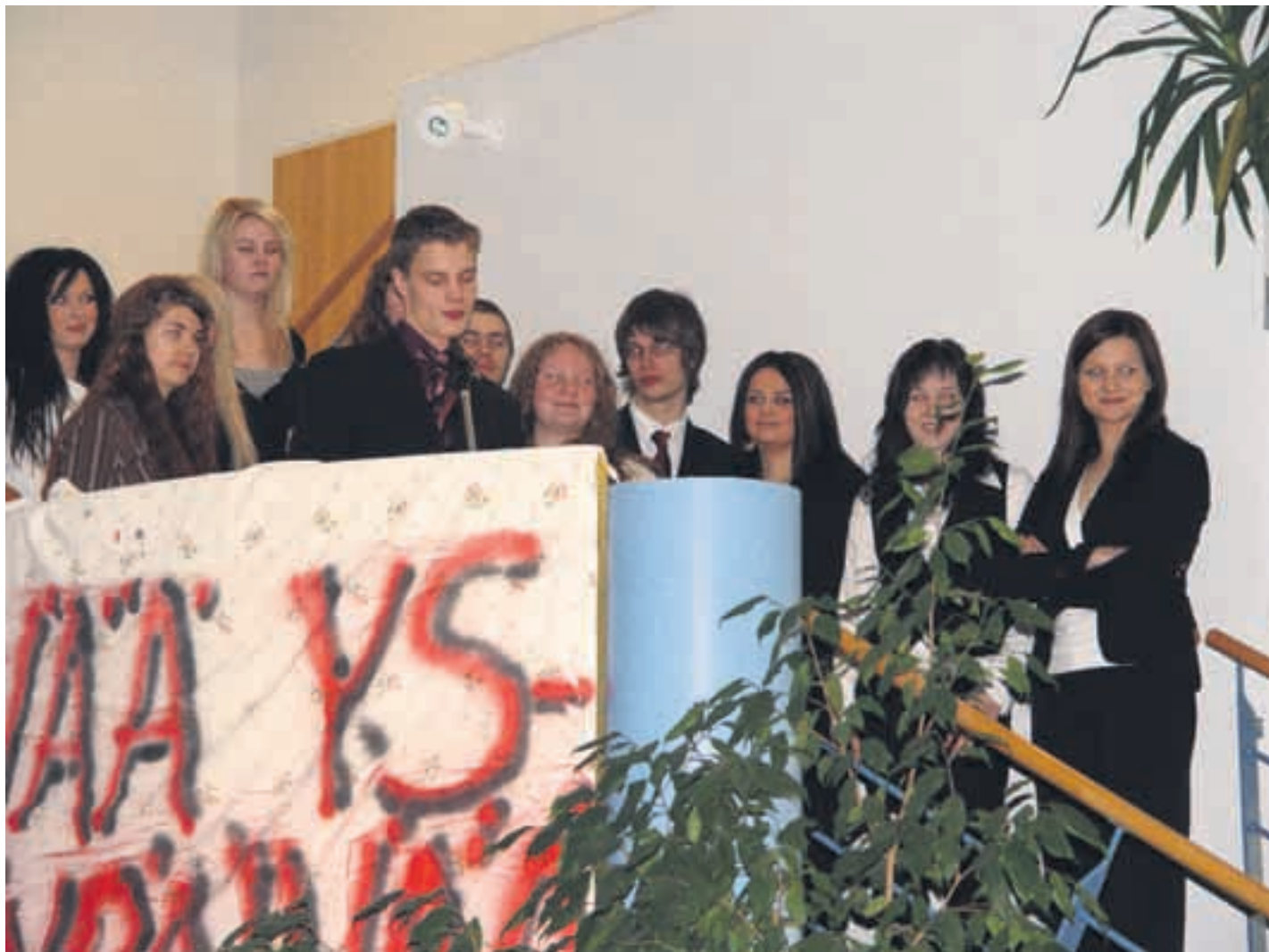
Viimeisen koulupäivän aamuna Pyhäjoen lukion abiturientit laittavat päälle juhlavaatteet: tyylikkäästi mustaa. Koko koulu sai kuulla filosofishenkisen aamupohdinnan.