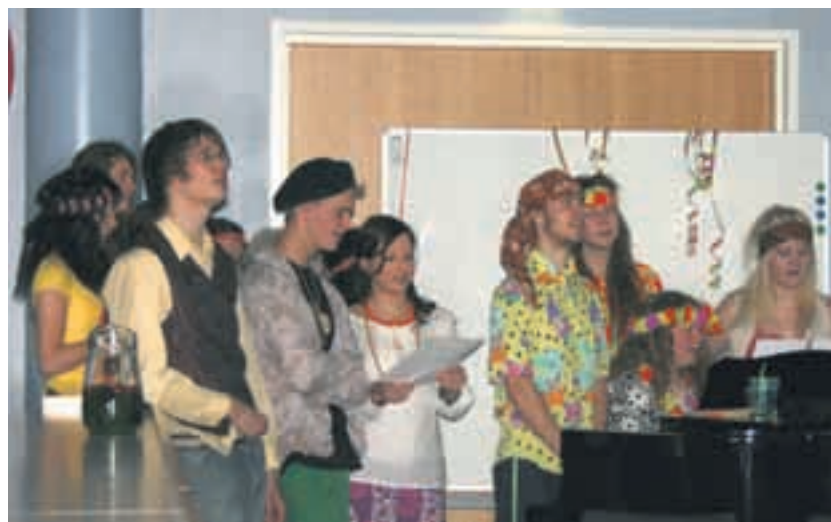
Abit kajauttavat reippaasti tekemänsä abilaulun - Koulutie.

Koulutie Paljon antoi meille koulutie Lukiossa vasta huomasiin, ei helppoo oo tää koulutie.