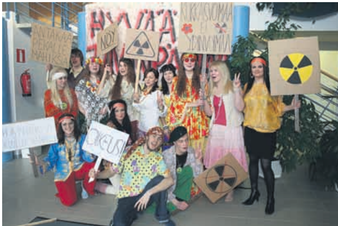
Ydinvoimakeskustelu velloo Pyhäjoella kiivaana. Hippiaabit naurattivat lukion väkeä toivomalla kukkaisvoimaa, ei ydinvoimaa. Hipit myös julistivat, että Hanhikivi kuuluu hanhille.