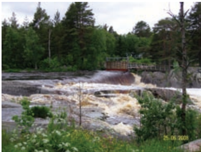
Nyt riittää Pyhäjoessakin vettä, kiitos sateiden. Joki on ääriään myöten täynnä ja koski kuohuu komeasti.