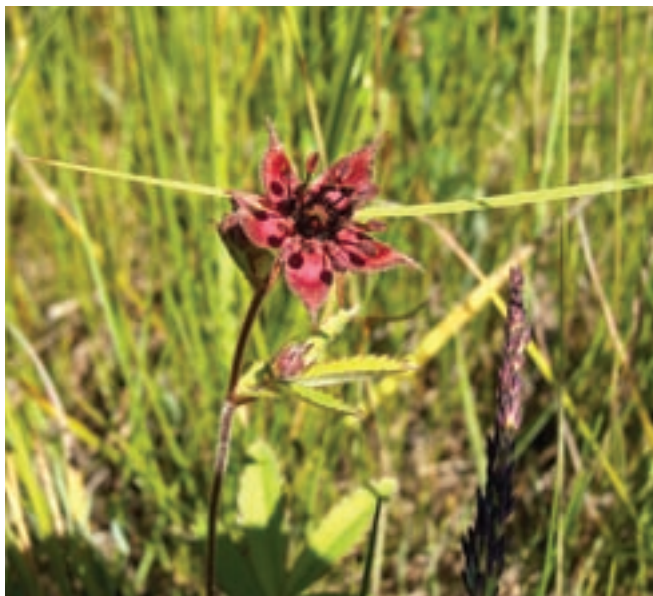
Viikon 27 kesäkuva: Kurjenjalka kauniisti kukassa. Kesäisiä kuvia saa lähettää toimitukseen edelleen.