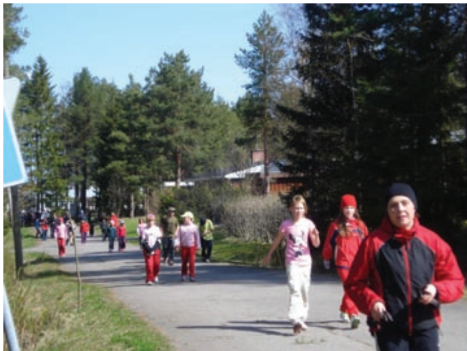
Yli 300 alakoululaista tempaisi toukokuussa Intian lasten hyväksi. Kuva Ruukinkankaalta.

Myös Operaatio Ruut on päässyt tästä tuesta osalliseksi. Asuntola rakennettiin sillä tuella. Nyt Ruut on lähettänyt ulkoministeriölle uuden anomuksen toisen kerroksen rakentamiseksi Yercaudin asuntolaan. Asuntolan valmistuminen laukaisi Yercaudin syrjäkylissä koulutusinnostuksen. Meidänkin lapset voivat päästä kouluun! Asuntola tarvitsisi heti lisää tilaa. Ulkoministeriön päätös saadaan joulukuussa.