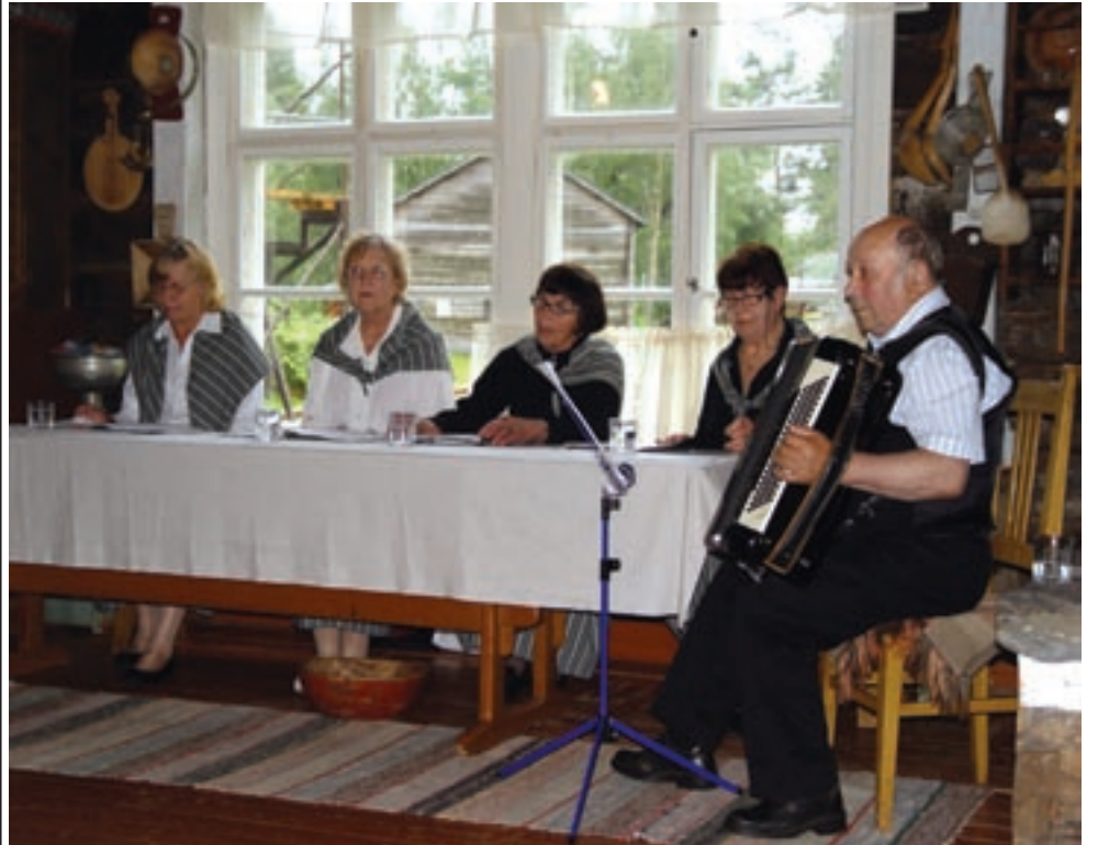
Annalassa tiistaina 22.7 vietiin jälleen mahtavaa iltaa runojen ja laulujen parissa.