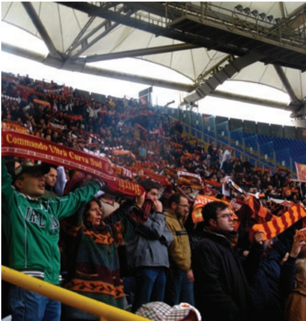
Jotta pääsi jalkapallostadionille, piti läpäistä tiukat turvatarkastukset. Jokaisella oli omalla nimellä varustettu pääsylippu. Jalkapallo-ottelussa oli jännä seurata, miten italialaiset fanit kannustivat.

Poistun stadionilta ja mietin; jalkapallo Italiassa – ei tosiaanakaan "vain" jalkapalloa.