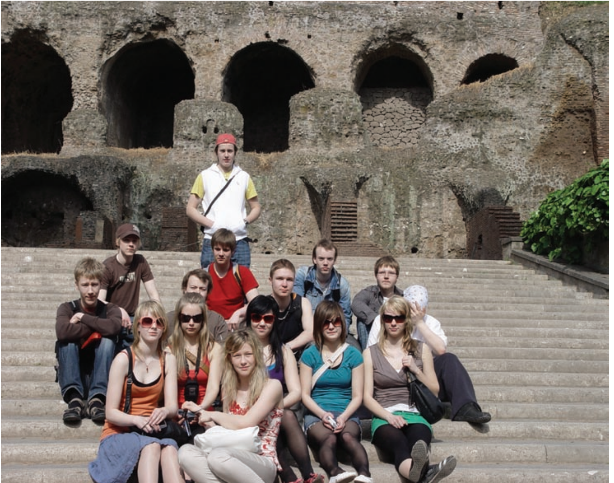
Forum Romanumin pylväiden, pylväskäytävien ja kaariholvien keskellä voi kuvitella mielessään suuren keisarillisen kaupungin keskuksen, Euroopan ensimmäisen, jossa oli miljoona asukasta.