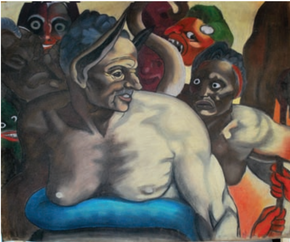
Maija Martinmäen työ on myös osa Michelangelon Viimeistä tuomiota. Sitä pidettiin aikanaan moraalityöksi ja sitä nimiteltiin muun muassa "alastomien vartaloiden muhennokeksi".

Renessanssin aikaisia luomuksia ovat muun muassa Pie-