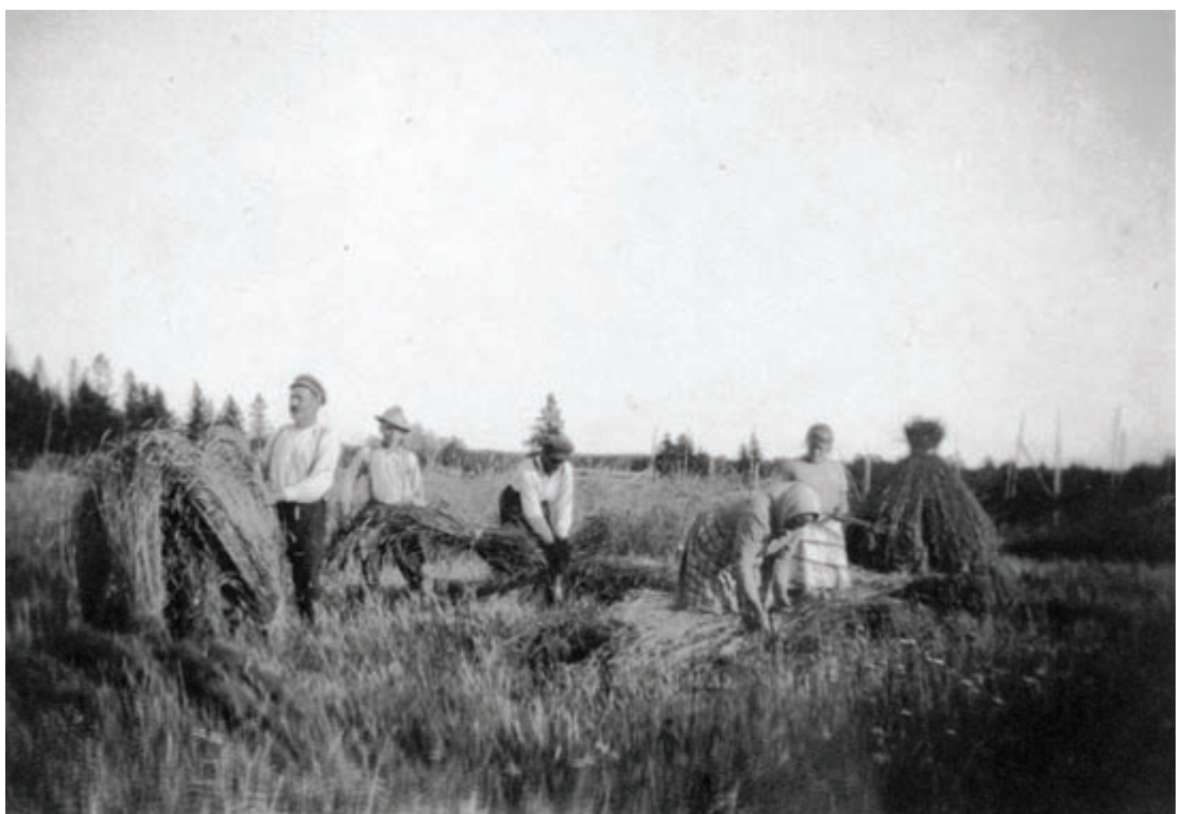
Kiiskilän väkeä elonkorjuussa