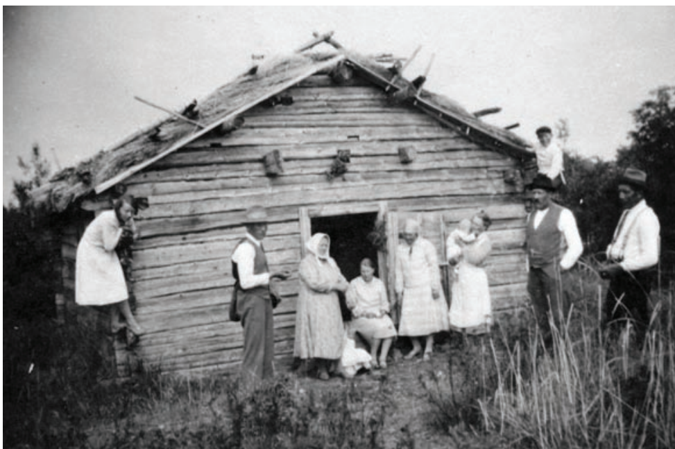
Kiiskilän väkeä heinänteossa

Kun riihi oli valmis puitavaksi, nousi riihiväki kello 2 - 3 aamu-yöllä ja lähti hiljaa riihelle. Joka talon väki yritti päästä ensimmäisenä aloittamaan puinnin. Ensin pudotettiin lyhteet parsilta ja sitten seurasi iskeminen, jolloin joka lyhde iskettiin riihen seinään. Siinä saatiin parhaat