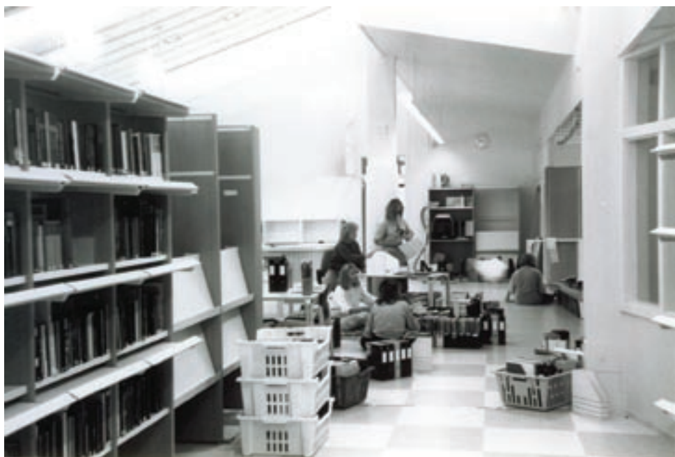
Kirjoja järjestetään uudessa kirjastossa kesällä 1990