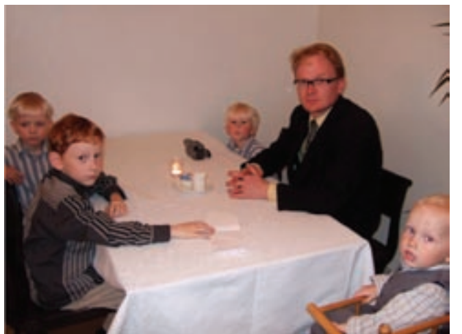
Isä ja lapset saman pöydän äärellä