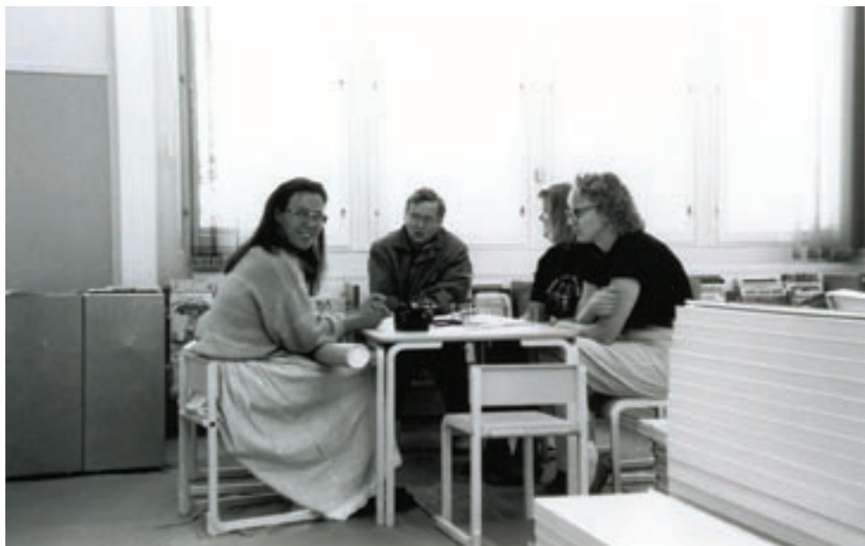
Uuden kirjaston kalustuksessa huilitauko hyllykasojen keskellä