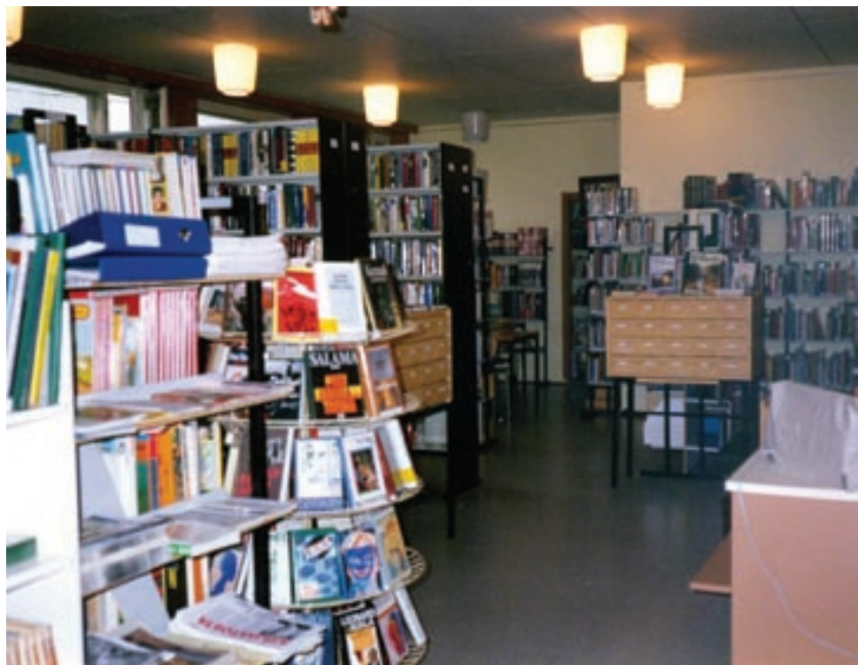
Täyttä vanhalla kirjastolla