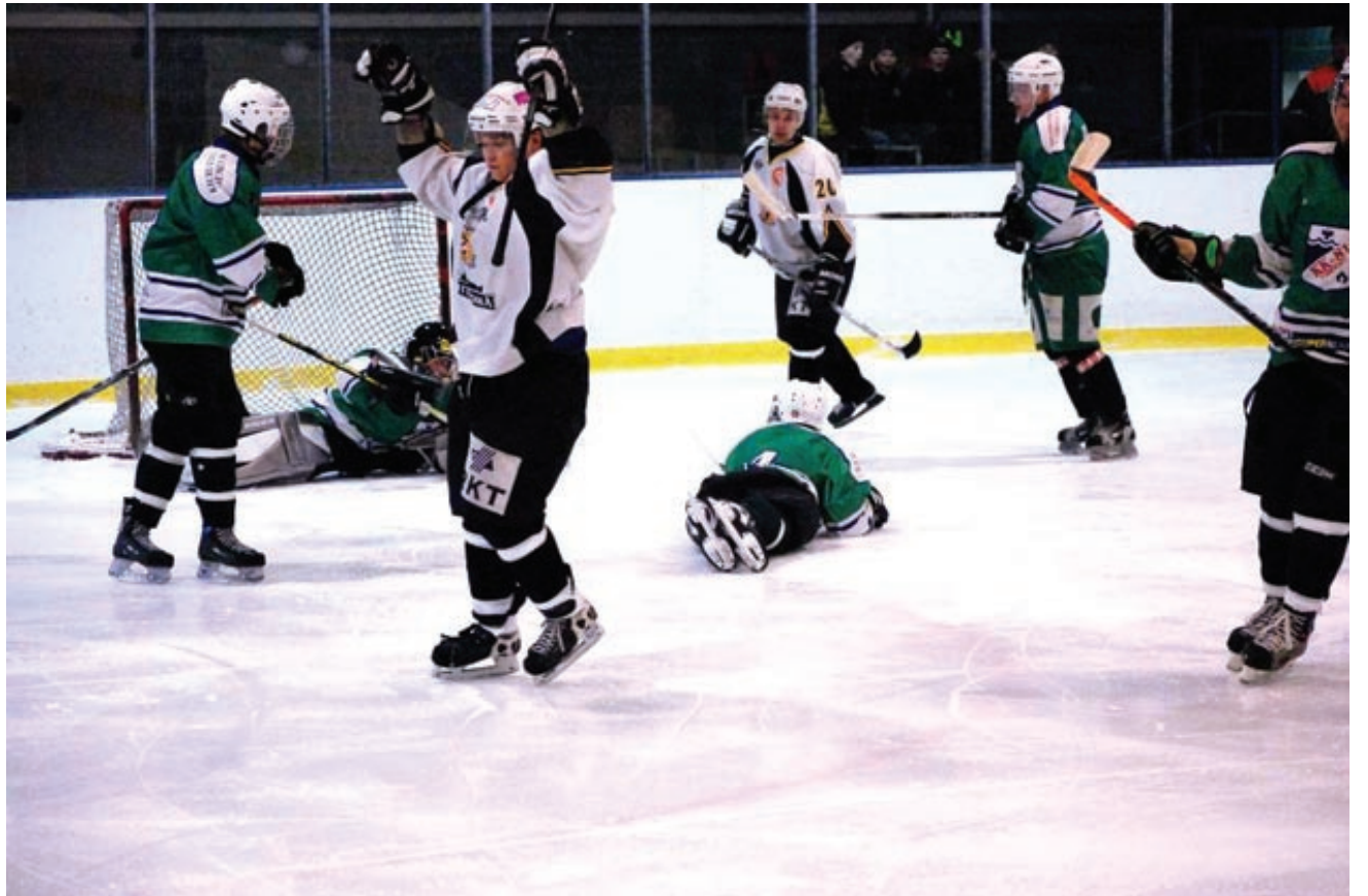
Näihin tunnelmiin päättyi edellinen PJK:n ja KK-81:n kohtaaminen.

Sunnuntain peli "Kielosaaren hornankattilassa" alkaa kello 16. Liput 5e, lapset, eläkeläiset ja opiskelijat 3e. Tervetuloa katsomaan, tehdään yhdessä Kielosaari Areenasta kiuruvetisille mahdollisimman hankala paikka pelata!