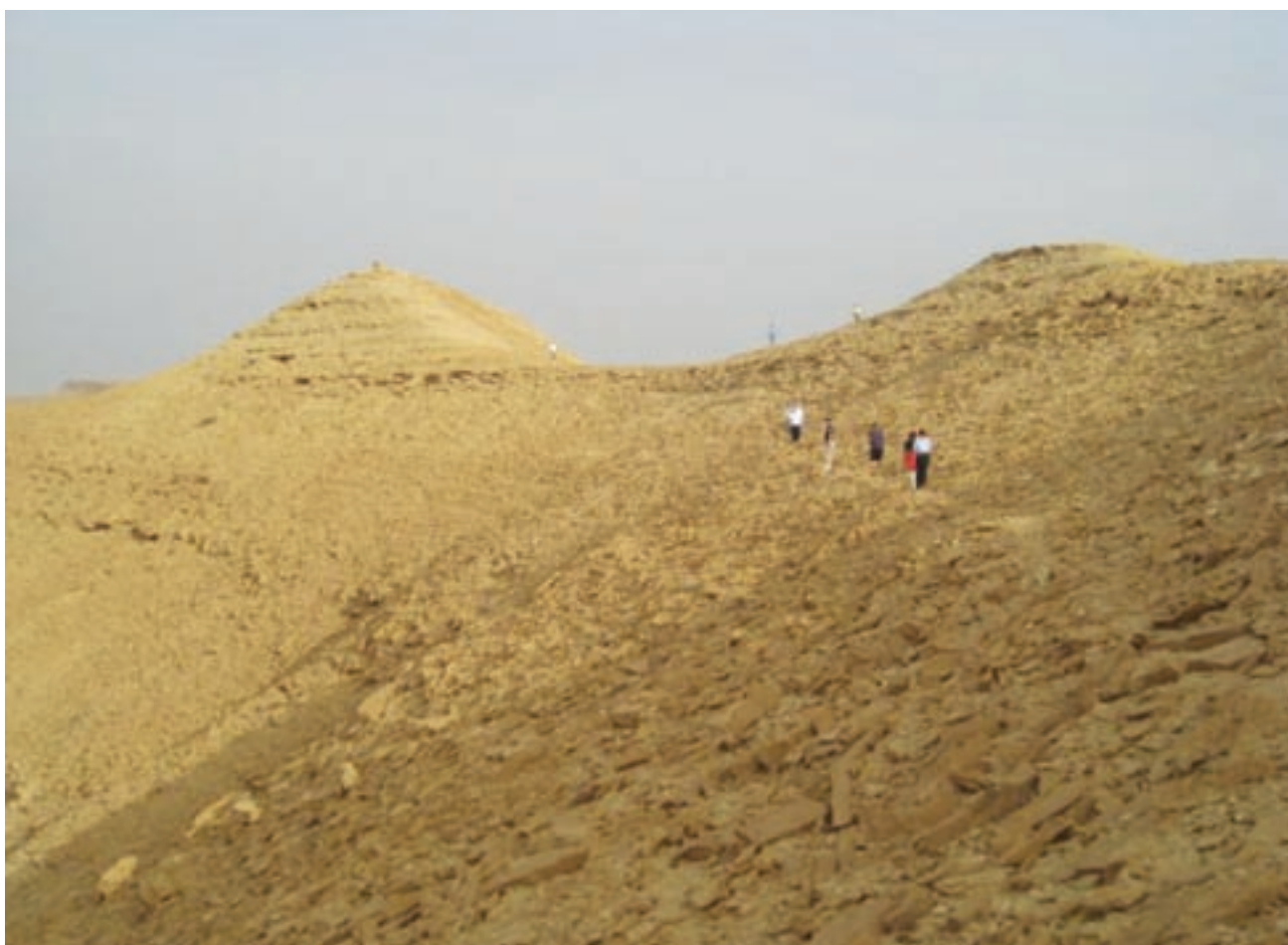
Saudi-Arabiassa suosittu harrastus on erämaakävely.

tävät tarpeen. Suomalaiset pitävät tiiviisti yhteyttä, ja heitä onkin siellä noin 40 hoitajaa.