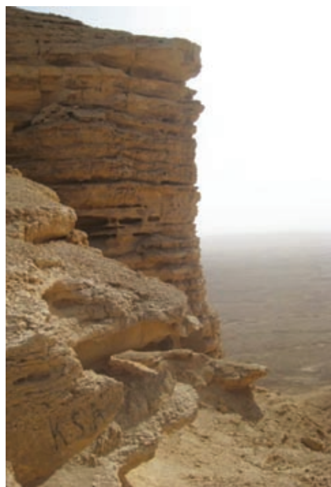
Hiekka ja kivimaisemat ovat Suvin mielestä karulla tavalla myös kauniita.