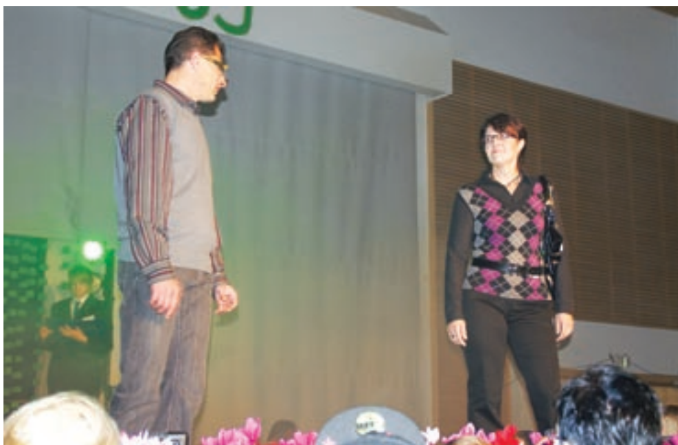
Viime vuoden messuilla muotinäytöksen osallistui myös messutiimiläisten vanhempia.