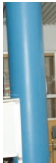
Viime vuoden messu...