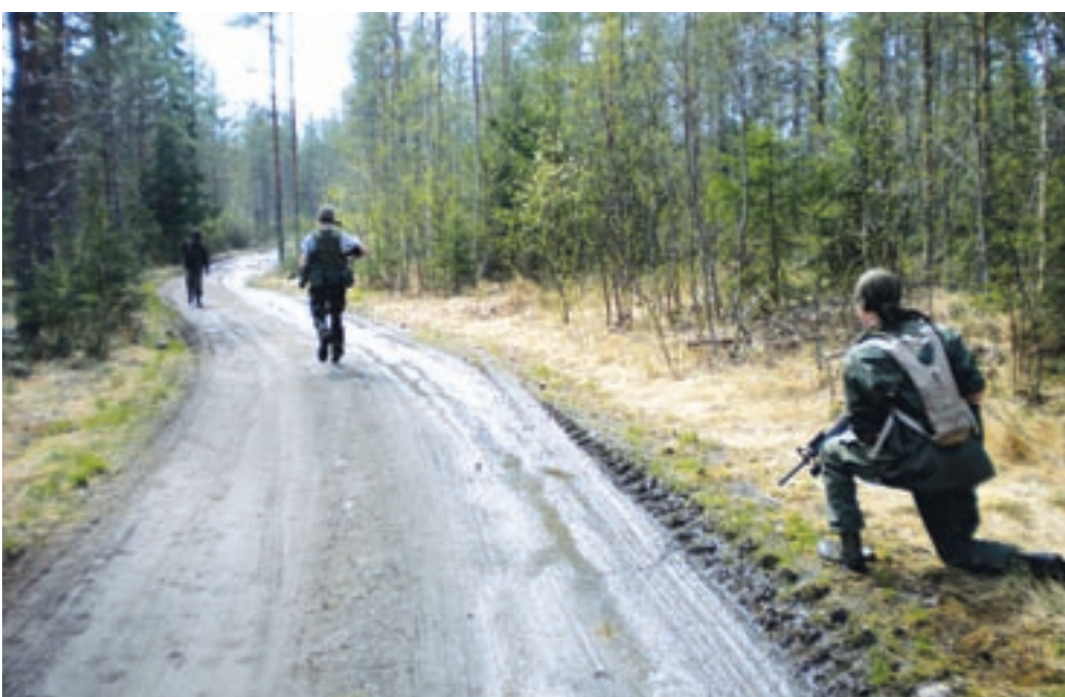
'Softausta' Raahen tähtitornin ympäristössä.

Pelaamista varten tarvitaan totta kai airsoft-ase ja muovikuulia. Hyvä vaatetus taas toimii sekä suojana kuulilta että tunnelman luomiseen. Maastopuvut ja armeijan varusteet, kuten taisteluliivit ja kypärät, ovat tavallisia. Airsoft on melkein enemmän eläytymistä kuin todellista urheilua.