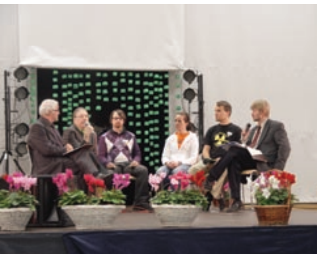
Viime vuoden paneelissa keskusteltiin muun muassa ydinvoimasta.

Yleisö on myös täysin vapaa ot- tamaan osaa keskusteluun. Pai- kalle kannattaa siis tulla heitte- lemään kysymyksiä tai ihan vain kuuntelemaan keskustelua, joka varmasti tulee olemaan kaikin puolin kiinnostava.