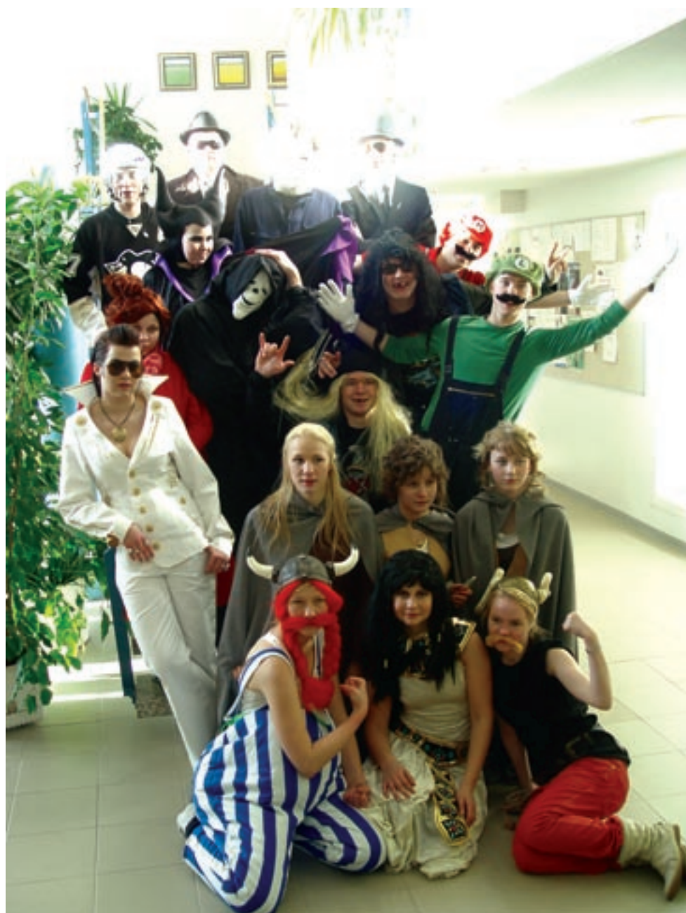
Pukeutumisessa oli käytetty mielikuvitusta.

Huomenna, jos Jumala suo ja sää sallii, olemme me abit vapautuneita Viitasen opeista ja Sarin angsteista, sekä lukion päivänavauksista. Myöskään derivaatat, osittaisintegraalit, taikka englannin verbioppi eivät mieltämme masenna ainakaan kahteen päivään. Julistetaan täten siis yleinen koulurauha.