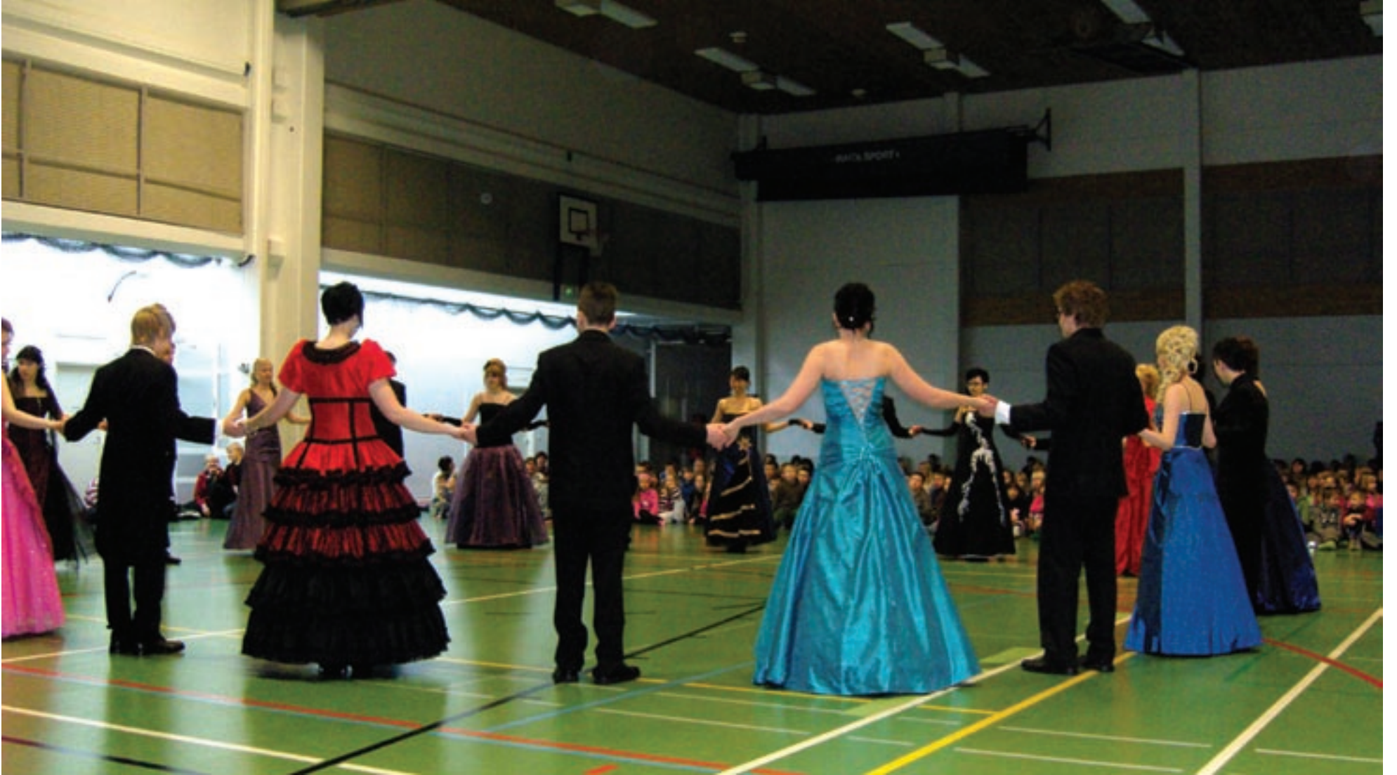
Wanhhat 2010 olivat kauniita ja komeita. Tanssit onnistuivat upeasti.