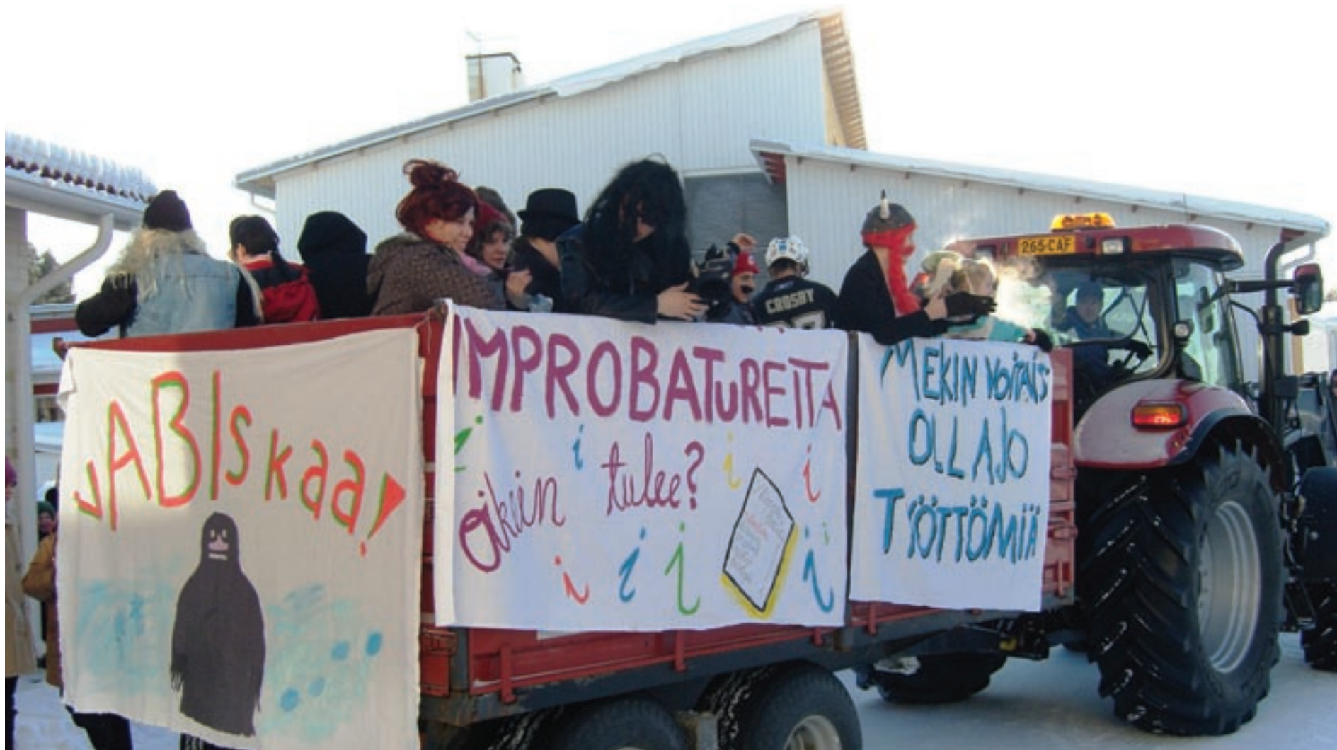
Arvaamattomat abit juhlivat viimeistä koulupäivää riehakkaasti - mutta hyvällä huumorilla. Lukion väki kiittää ja toivoo mukavia lukuhetkiä. Ylioppilaskirjoitukset jatkuvat 15. maaliskuuta; silloin on vuorossa äidinkielen esseekoe