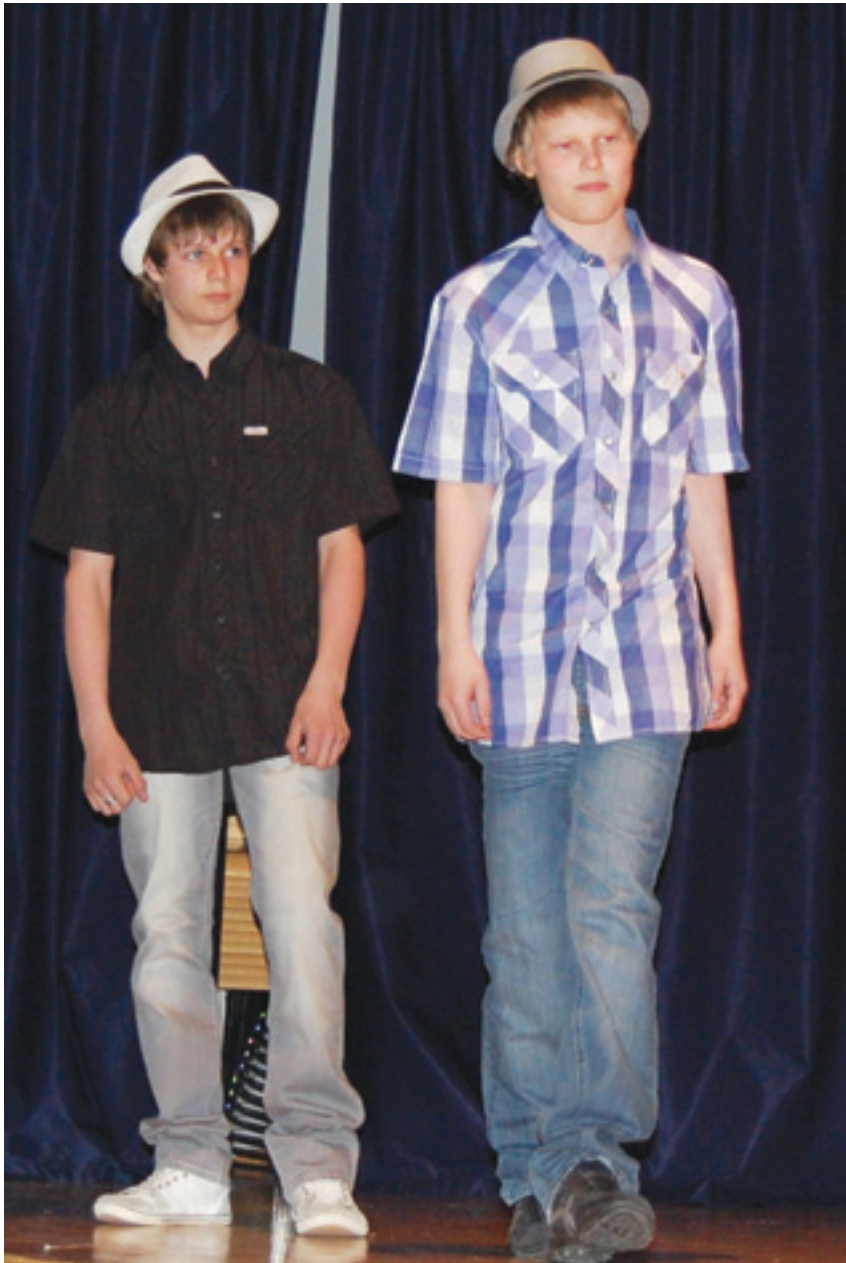
Rennompaa pukeutumista kesän juhliin.