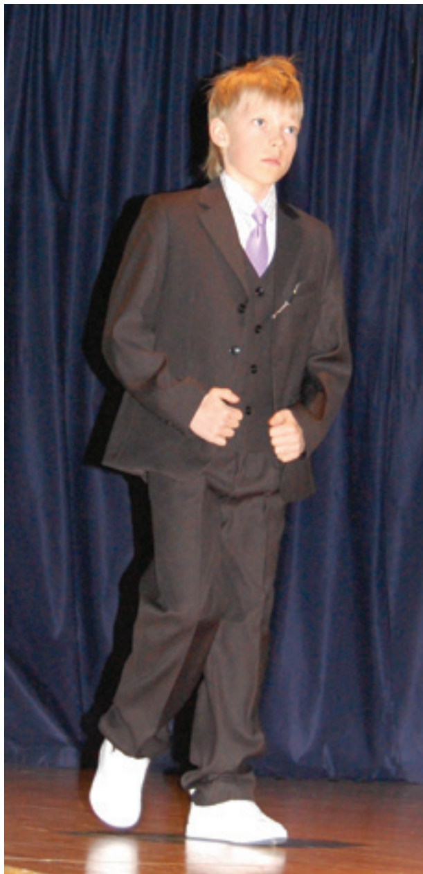
Muotinäytöksessä esiteltiin kesän juhlamuotia.