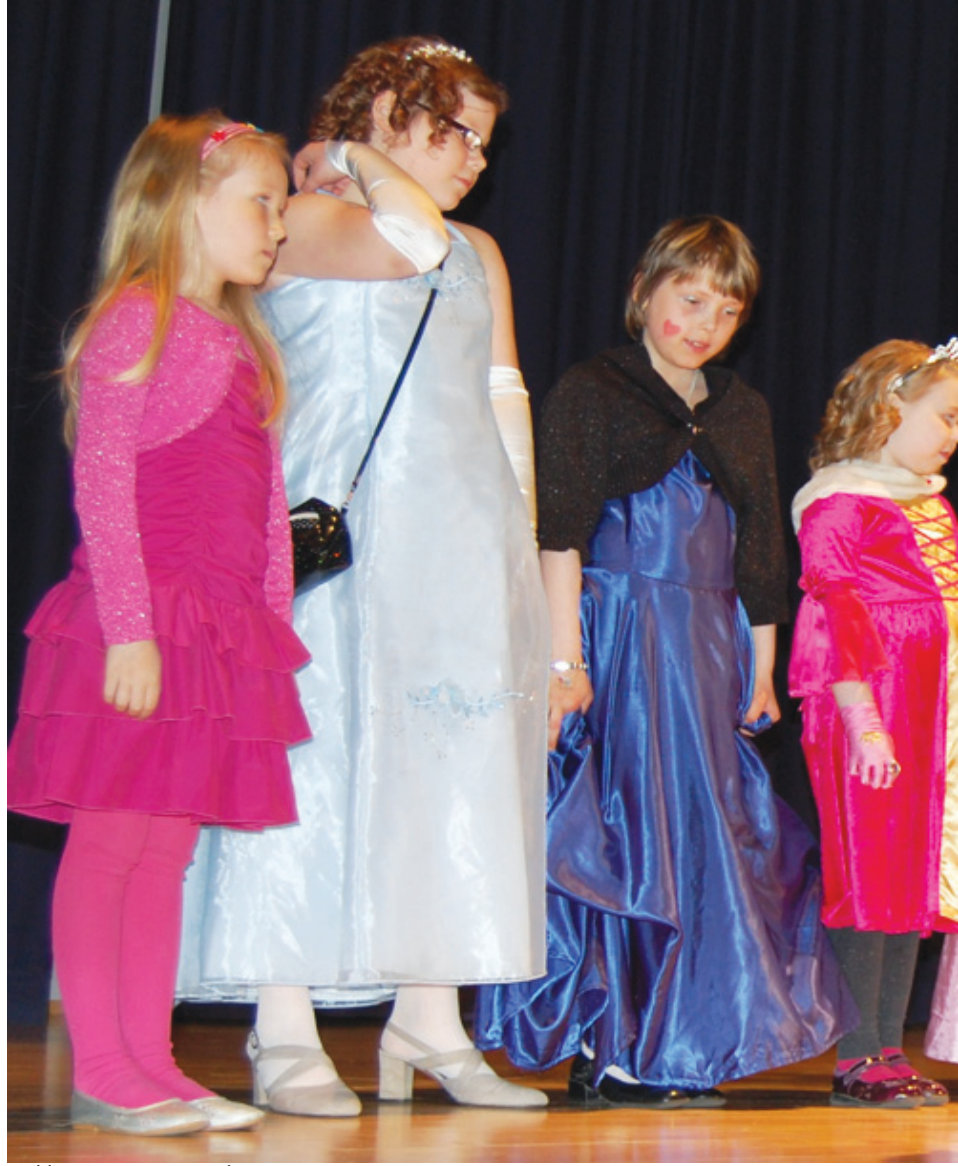
Juhlien Prinsessat esittelivät omia asujaan.

Koko seiskaluokka ja opettajat sekä vanhemmat haluavat vielä kerran kiittää kaikkia messuilla olleita yrittäjiä ja vieraita: Kiitos, että olitte mukana!