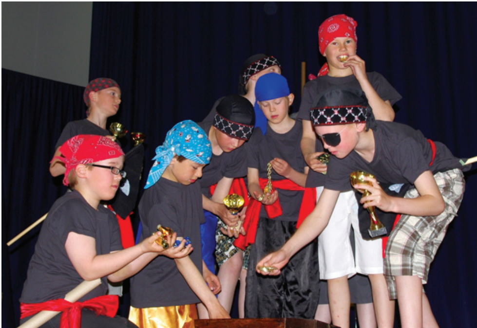
Alaluokkien kevätjuhlaa vietettiin meriteemalla.