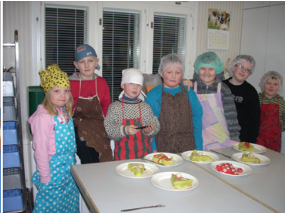
Leivontakerhossa oli makeeta!