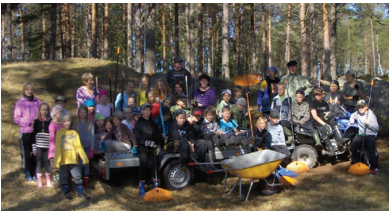
Siivouspäivä koululla. Ryhmäpotretti siivoojista.

Vuoden myönteisiin asioihin kuuluu joustotunti, jonka otimme käyttöön tänä lukuvuonna. Se tarkoittaa kiinteää tukiope- tustuntia keskellä työpäivää. Yhtenä tuntina viikossa olemme voineet ottaa koko luokan, pienen ryhmän tai yksittäisen oppilaan tukiope- tukseen kesken koulupäivän. Muut oppilaat ovat käyttäneet ajan kirjojen lukemiseen tai kertomusten kuuntelemiseen kouluavustajan johdolla. Tämä on osoittautunut erittäin hyväksi järjestelyksi koulullemme, sillä suurin osa