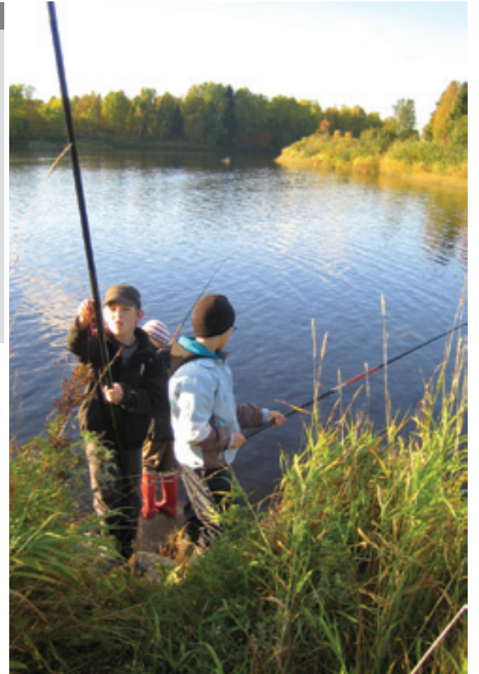
Kalastusilta Helaakoskella syyskuussa 2010.

Olimme haukikuninkuuskisoissa lauantaina 21.5. Sää oli erittäin huono, tuulinen ja vettäkin ripsautti illalla. Kisat järjesti Vapakalastusjaosto. Kalaa oli vähemmän kuin viimevuosina ja se oli keskimäärin pienempää. Osanottajia oli reilut 230 henkeä. Tarjolla oli makkaraa, mehua, pullaa ja karkkia. Suurimman kalan painon oikein arvannut sai täytekakun. Yleinsarjan pääpalkintona oli soutuvene ja nuortensarjassa valmiiksi pakattu uistinpakketti.