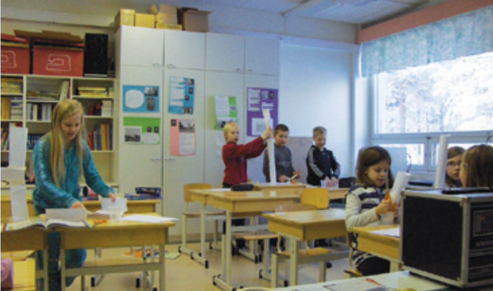
Tornin rakennusta A4 kokoisista paperiarkeista. Kilpailu käynnissä; kenellä tulee korkein ja tukevin torni.