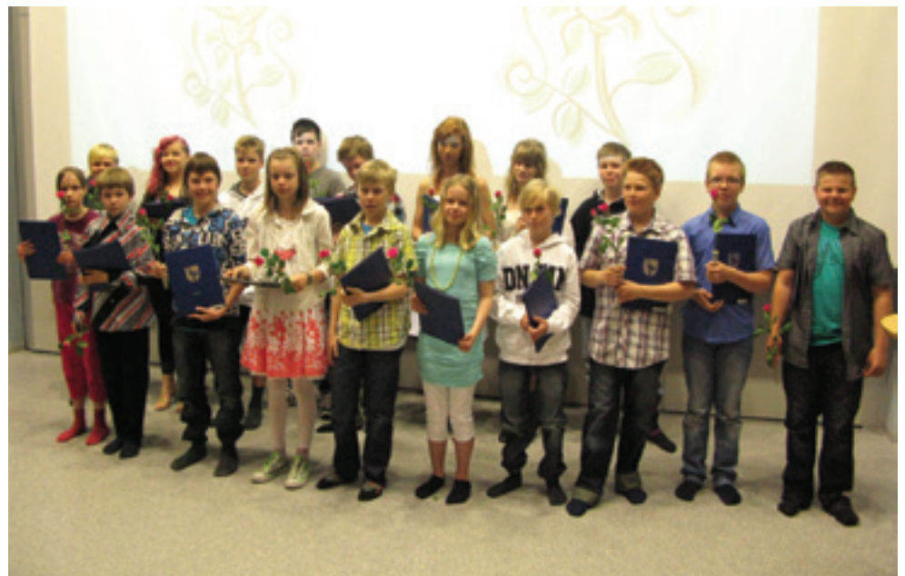
Kuudeluokkalaisten saivat todistukset ja ruusut päättöjuhlassa

Pidä lujasti ruorista kiinni ja anna mennä – täysin purjein.