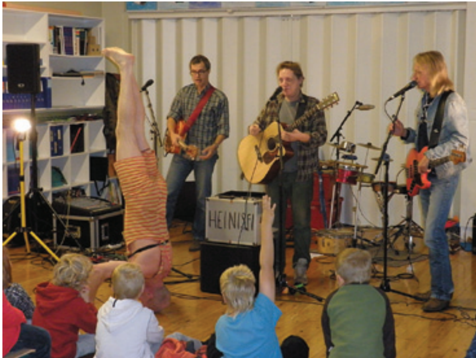
Herra Heinämäen rytmiorkesterin vierailulla sattunutta.

1. Sami Pietilä 2. Seitsemän 3. Parhalahdella. 4. Parhalahden koululla 5. ATK 6. Välitunti 7. Lukemista 8. Matikka 9. Makarooni 10. Leikitään piilosta, ja kiikutaan 11. Uinti 12. ATK, ruokailu, kuvis ja matikka että ei tuu läksyä