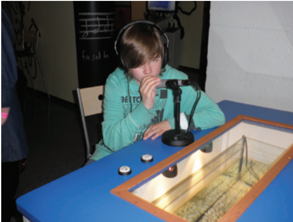
Äänimaailman testausta Tietomaassa.

Lopuksi haluan esittää kiitokset johtokunnan jäsenille koulun ja oppilaiden eteen tehdystä työstä. Toivottavasti hyvä työntekijä saa syksyllä jatkoa vanhempainyhdistystoiminnan merkeissä. Lisäksi haluan toivottaa sekä yhteistyötahoillemme että henkilökunnalle, oppilaille sekä kodeille aurinkoista ja virkistävää kesää!