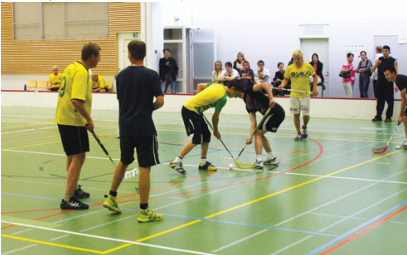
Viimeksi monitoimitalolla turnattiin lauantaina 28. elokuuta, kun 11 joukkuetta oli saapunut mitteleämään Pyhäjoen venetsialaissähly 2011 -mestaruuspokaalista. Kuvassa vaaleapaitainen raahelaisjoukkue ja tummiin pukeutunut yliveskalaisporukka aloittelemassa raahelaisten voittoon päätyttyä loppuottelua.

Lisätietoa Sählynharrastajista ja tulevista tapahtumista: http://www.pyhajoensahly.org/