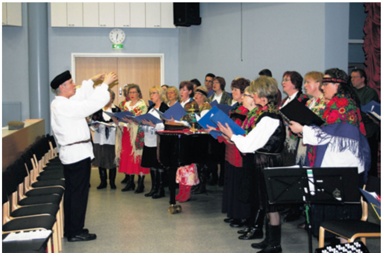
Soliseva kuoro Rannikon Venäjä-seuran 3. huhtikuuta 2009 järjestämässä illassa.

Elvistely käynnistyy maanantaina 12. syyskuuta kello 19.00 lukion Pauha-salissa. Tule, niin näytetään...!