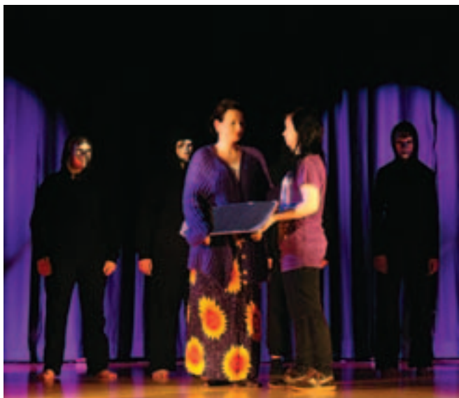
Tuhkimo oli menestys.

Perjantain nuorten illassa esiintyi Warikkoveijarit.