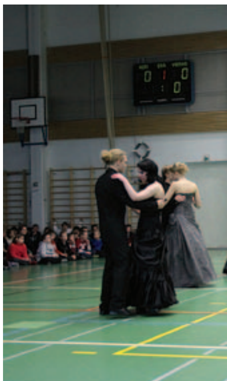
Monitoimitalolla helmat hulmusivat