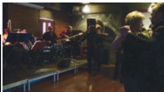
Pyhäjoen Pelimannien vetämät päivätanssit saivat parhaimmat palautteet.