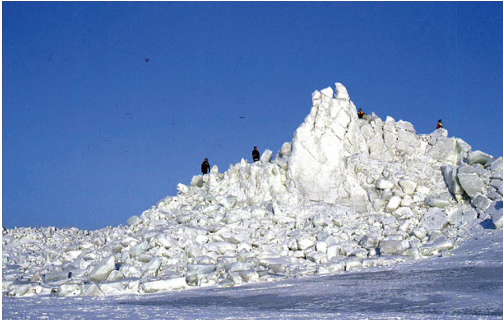
Hanhikivenniemi. Jääröysit talvella.

Vaikka ydinvoimala jättääkin jälkensä luontoon, Pahkala uskoo sen tuovan lisää mahdollisuuksia Pyhäjoelle: "Hanke sinänsä ja sen tuoma väestön lisääntyminen alueella tuo paljon uusia mahdollisuuksia ihmisille, jotka haluavat ja osaavat niitä hyödyntää."