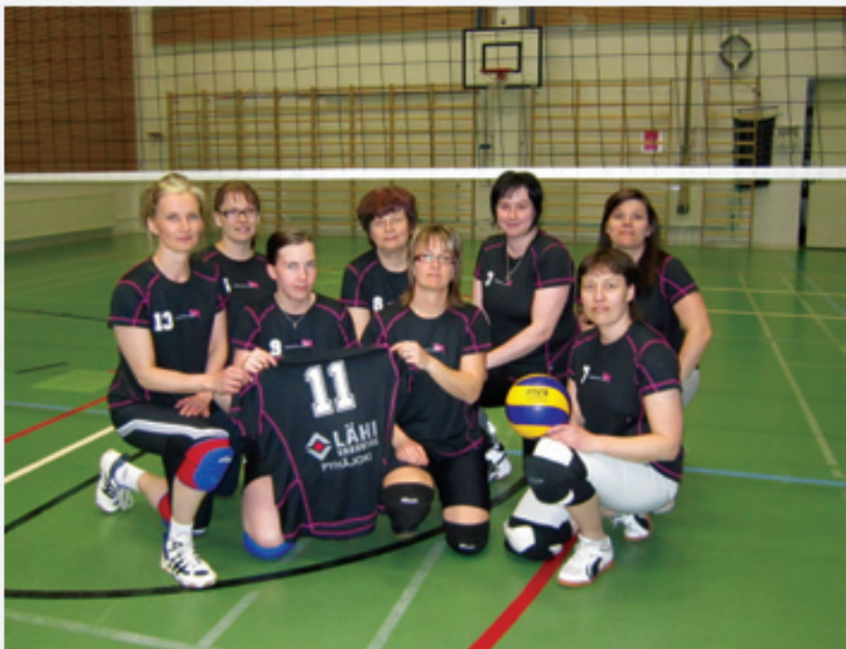
Kiitos Pyhäjoen Lähivakuutukselle sponsoroinnista.