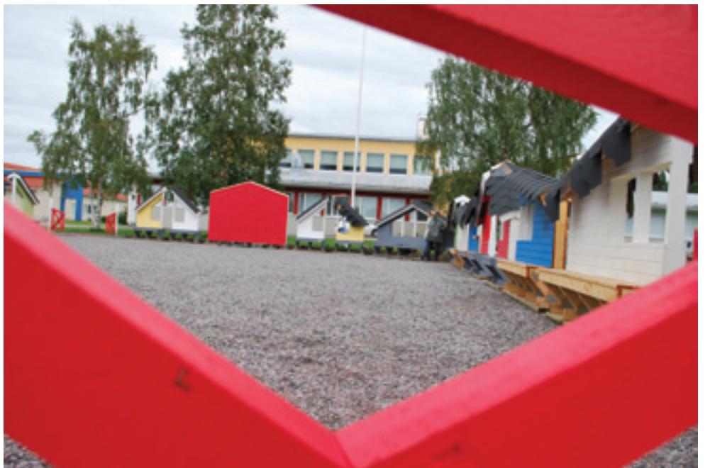
Tule juhlimaan Areenan avajaisia.