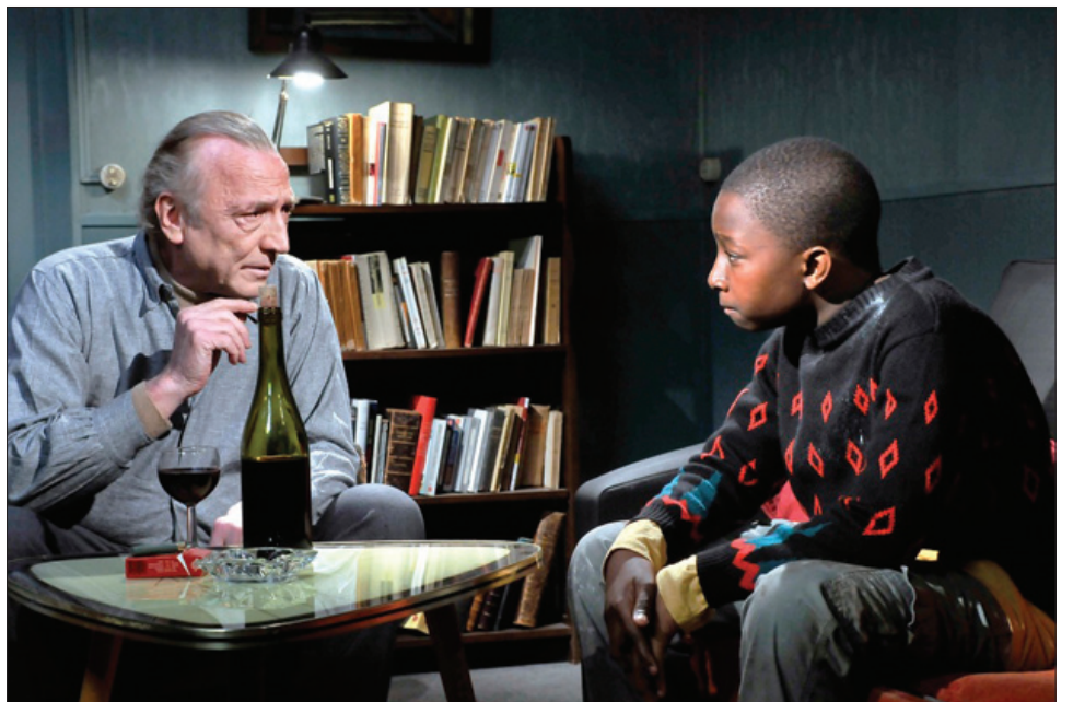
Aki Kaurismäen Le Havre aloitti kirjaston elokuvakerhon syyskauden.