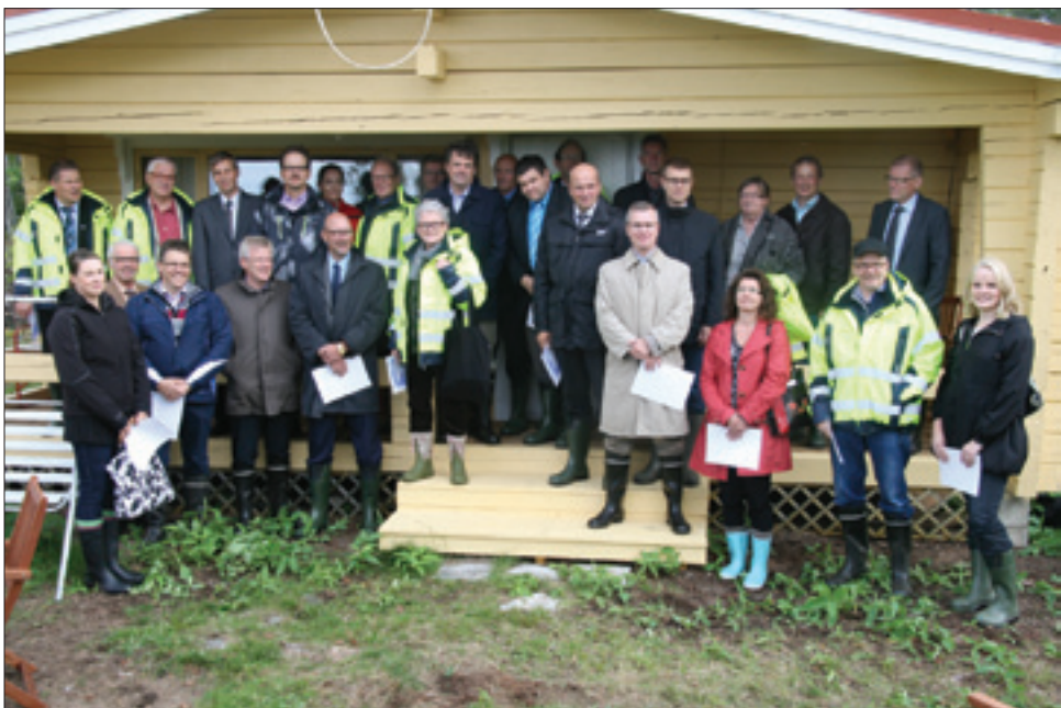
Ennen varsinaista kokousta tutustuttiin Hanhikivenniemen ja mm. Fennovoiman mökkiin.