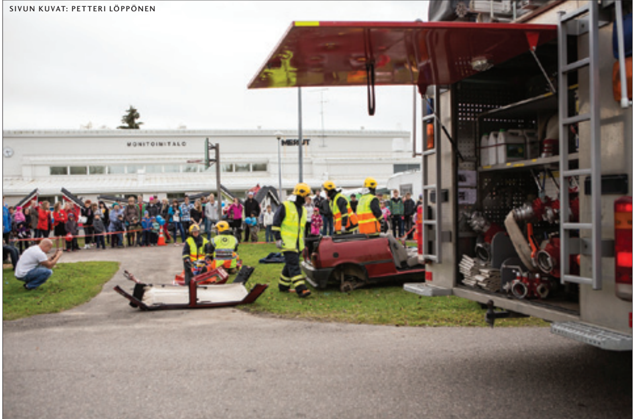
Messuilla oppi, miten onnettomuustilanteessa tulee toimia.