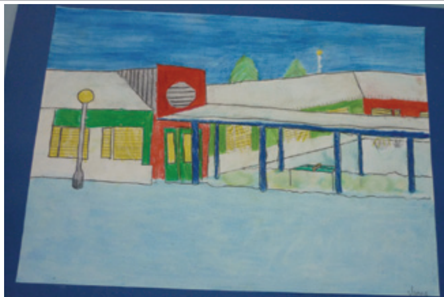
6.lk:n tekemiä kuvistöitä kotiseudun rakennuksista

tapahtuman, jolla halutaan kiinnittää huomiota paikallisuuteen ja sen mahdollisuuksiin. Myyntinäyttelyssä myydään alueella tuotettuja hyödykkeitä.