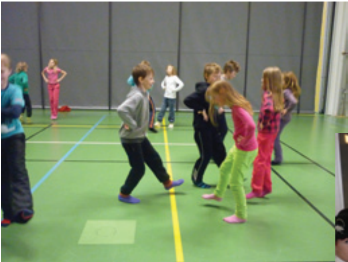
Tiistai 26.2. oli piirileikkipäivä. Leikittiin mm. Lintu lensi oksalle, Hans vili ja Tavallisen taajaan. Hauskaa oli!

Ainakin nämä lapset näyttävät olevan kovin tyytyväisiä elämäänsä täällä. Kunpa tämä tyytyväisyys pysyisi ja vielä kasvaisi iän karttuessa!