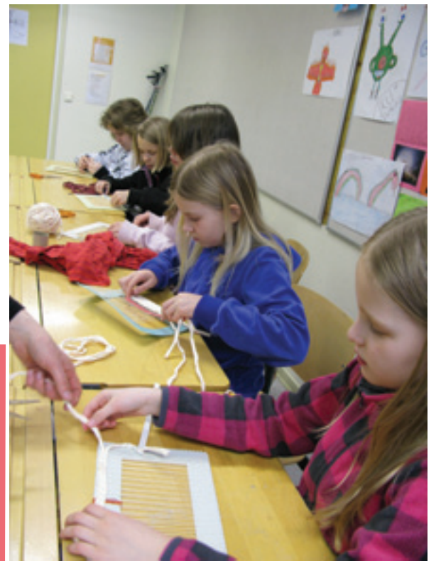
Toimintapäivänä keskiviikkona 27.2. leikattiin matonkuteita ja kudottiin