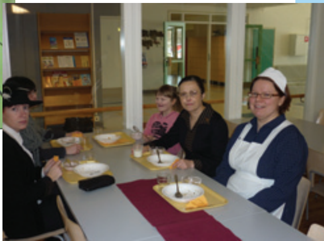
Henkilökuntakin oli pukeutunut vanhaan tyyliin.