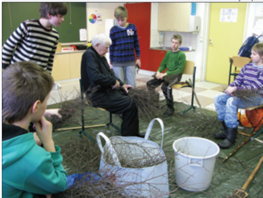
...saatiin oppia mestareilta