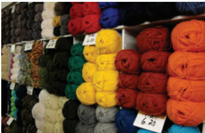
Perkiömäen liikkeestä löytyy kaiken väristä lankaa neulomista harrastaville.

-Tämä kauppa on elämäntyöni. Tällä alalla ei saa lannistua. Pitää kohdella kaikkia asiakkaita samalla tavalla. Mukavaa työtä tämä on!