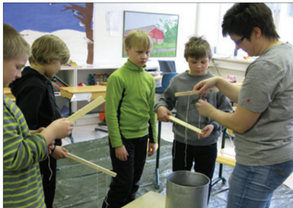
...valettiin kynttilöitä. Lisäksi vuoltiin paistinlastoja ja taottiin seinäkoukkuja.