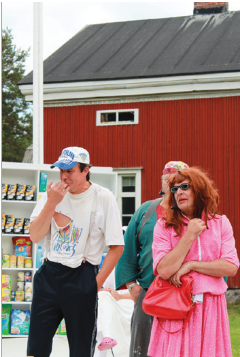
Jo vain herra ministeri näytökset 5.-7.7. peruttiin päänäyttelijän sairastumisen vuoksi. Ilmoitamme jatkosta mahdollisimman pian.