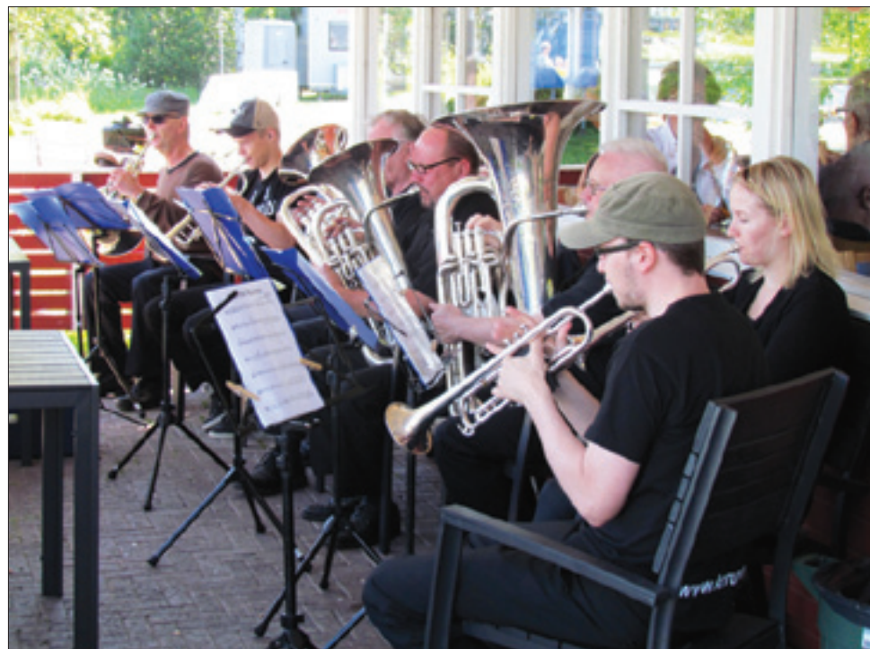
Muistojen häälvalssi viritti tunnelmaan lauantaisena kesäiltapäivänä. Torvisoittajia, vaan ei totisia, kerääntyi Kielosaaren kahvion terassille. Repertuaari sisälsi monta tuttua kappaletta Mantsurian kukkuloilta La palomaan. Saaren soittajat Rovaniemeltä piipahtivat kierroksellaan myös Pyhäjoella. Kahviossa ja pihalla oli kuuntelijoita, joskin enemmän olisi vielä mahtunut. Ja ehdottomasti olisi kannattanut tulla kuuntelemaan. Ihanaa, kun on tällaisia tapahtumia!

Lähiaruokamarkkinoista lisää elokuun alun Kuulumiset-lehdessä.