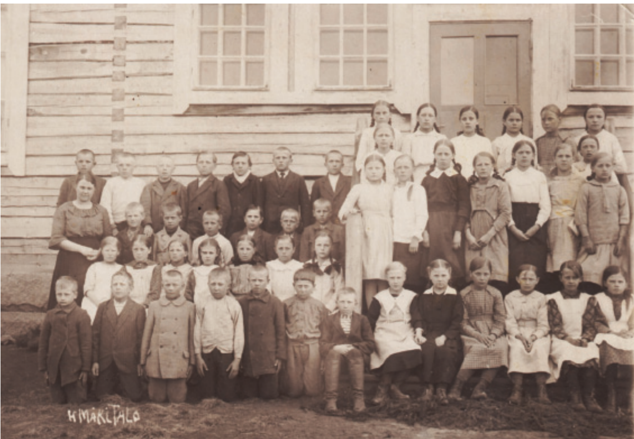
Koululaisia lukuvuonna 1920-1921.