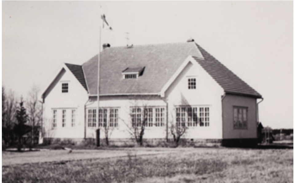
Parhalahden koulu 60-luvulla.