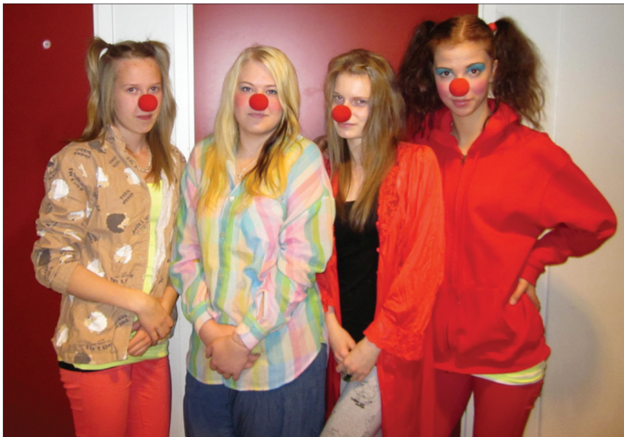
Saaren koululla vietettiin Nenäpäivää 9. marraskuuta. Oppilaskunnan hallitus ja tukioppilaat järjestivät nenäkahvilan. Päivään kuului myös teemamukainen pukeutuminen.