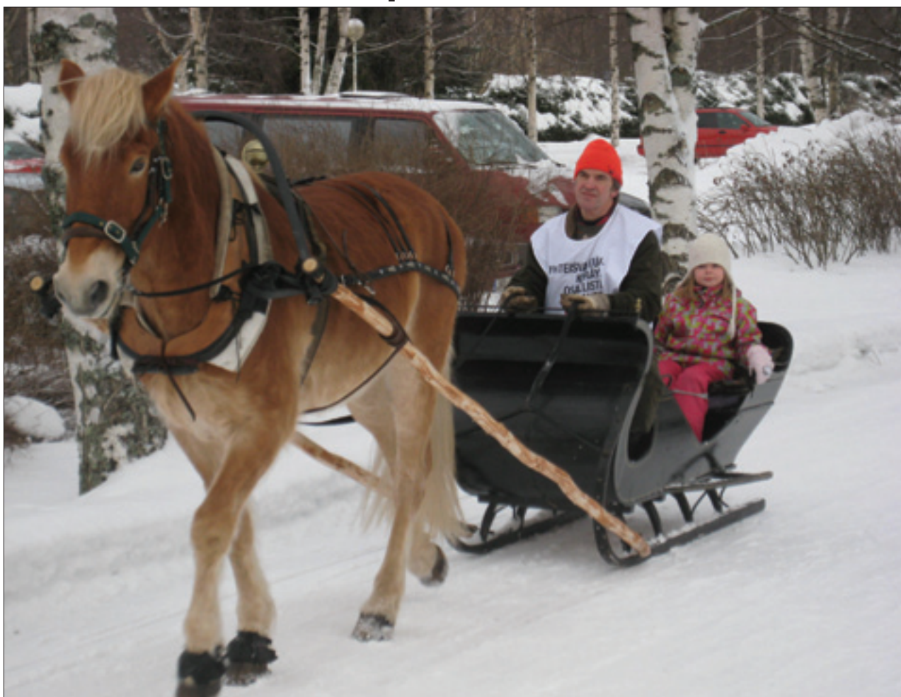
Lämmin kiitos kaikille jotka tavalla ja toisella osallistuite Runebergintorttu-projektiin ja Yhteisvastuutempaukseen! Tuotto Yhteisvastuulle 1700 euroa. Kiitos!