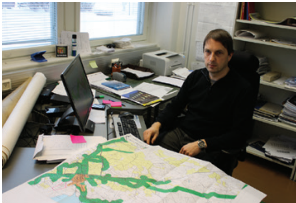
Pyhäjokisuun Vesi oy:n toimitusjohtajalla on piisannut kiireitä. Runkoverkkoon liittyen on tehtävä isoja päätöksiä samalla, kun varmistetaan päivittäisten toimintojen sujuminen. Pienessä yhtiössä ei ole turhia väliportaita. Ja palvelu ja palautteet tulevat suoraan.

Pyhäjokisuun Vesi oy on vesilaitos, jolla toiminta-alueellaan on velvollisuus toimittaa vettä. Toiminta-alueeseen kuuluu Pyhäjoen koko asemakaava-alue, ja tämän lisäksi veden osalta haja-asutusalueella 100 metriä runkojohdon molemmille puolille. Viemäriin osalta haja-asutusalueella vastaava etäisyys on 60 m. Käytännössä sekä vesi että viemärituodaan kaikille tarvitsijoille. Toiminta-alueen ulkopuoli-