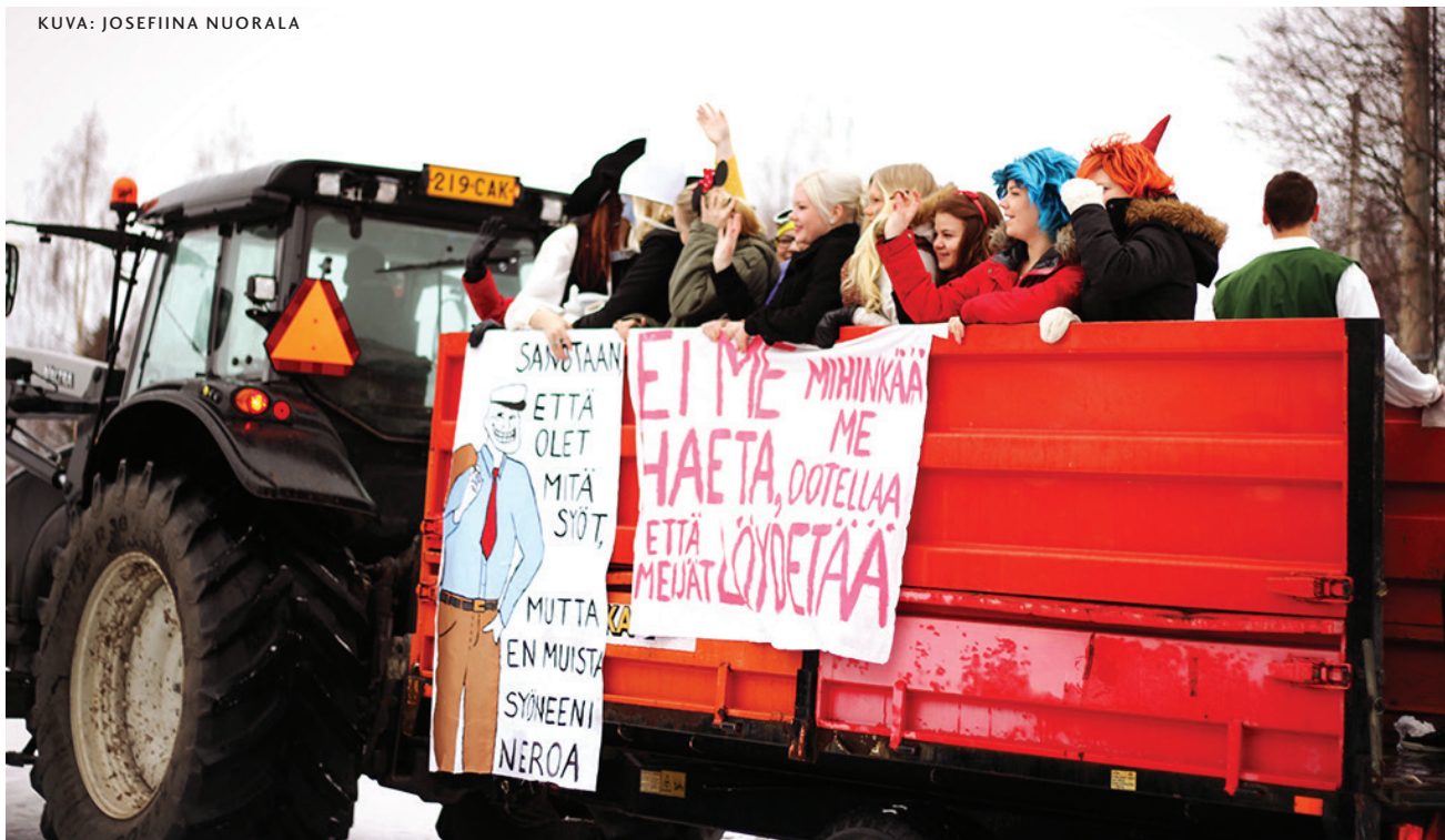
Pyhäjoella penkkari ajettiin perinteisesti traktorilla. Teeman a tällä kertaa olivat satuhahmot.