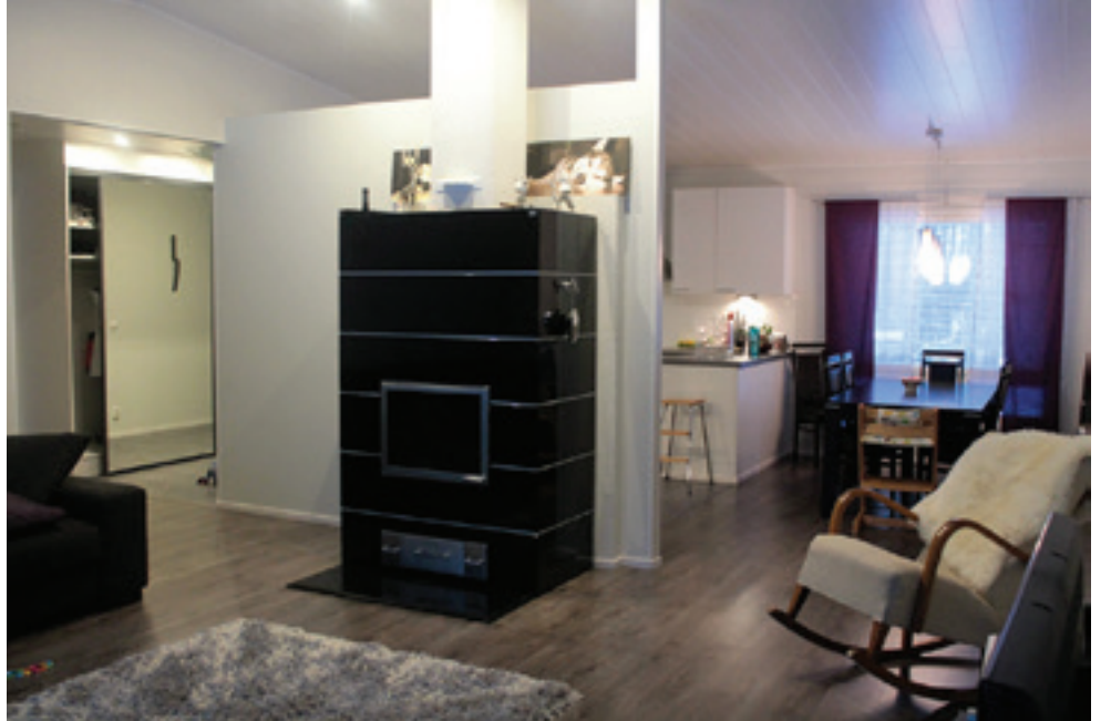
Avaraan olohuoneeseen kuuluu ilman muuta takka.