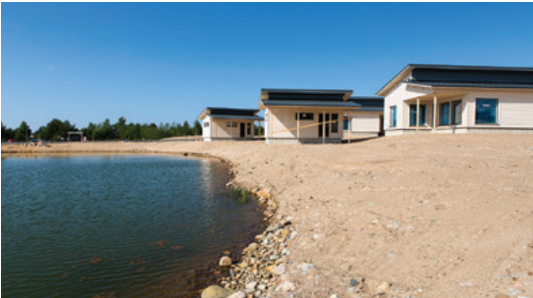
Ennen rakennustöiden aloittamista Aurinkohiekan lampi ruopattiin lammenrannan tontteja varten kuntoon.