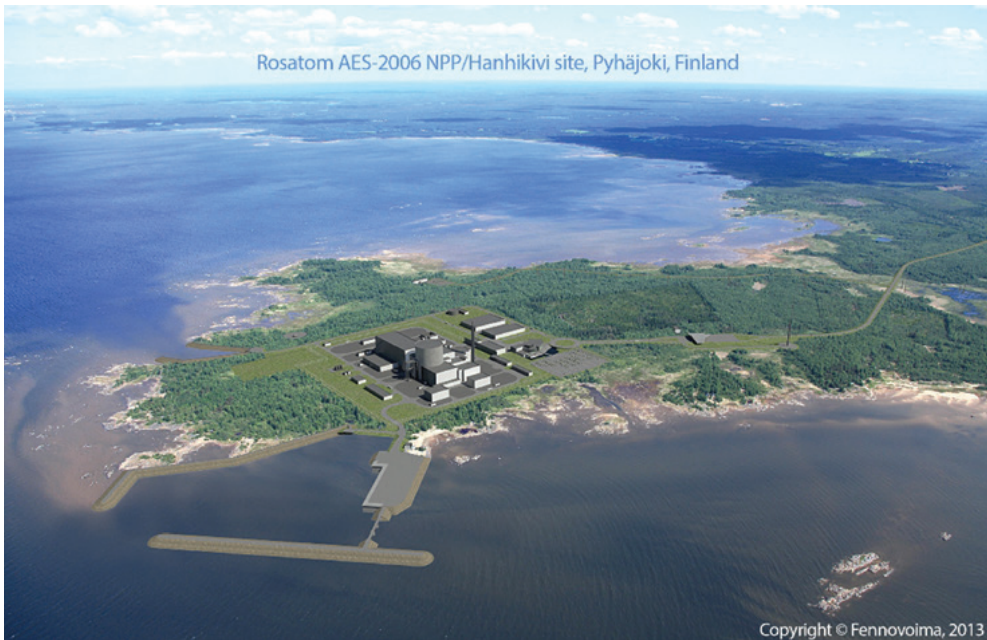
Havainnekuva Rosatomin laitoksen sijoittumisesta Pyhäjoen Parhalahdelle.