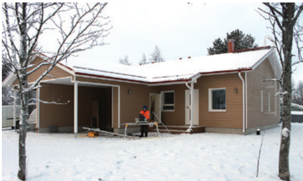
Paritalo tarjoaa mukavasti työtä remonttien väliin

Pyhäjoella toimii useita pieneköjä rakennusliikkeitä. Näillä liikeidea on usein syntynyt työn lomassa niin, että aktiivinen kirvesmies on jossain vaiheessa halunnut kokeilla siipiään. Ja kun siivet ovat kantaneet, homma on jatkunut. Näin on myös pyhäjokisella nuorella, toisen polven rakennusyrittäjällä Esa Impolalla .