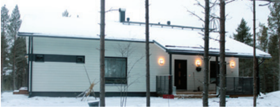
Pyhäjoelta löytyy todella hienoja rauhallisia rakennuspaikkoja.