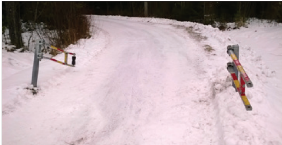
Kalliotien päästä alkavan kevyenliikenteen väylän kulkuportit rikotaan tahallaan. Muutamat henkilöt hajoittavat ne työkoneilla ja sen jälkeen ajavat muutkin läpi Vihannintielle siitä. Kallista korjausta kunnalle. Ja vaarannetaan mm. lasten liikkuminen turvallisesti ajatellulla reitillä. Se on kevyenliikenteen väylä.