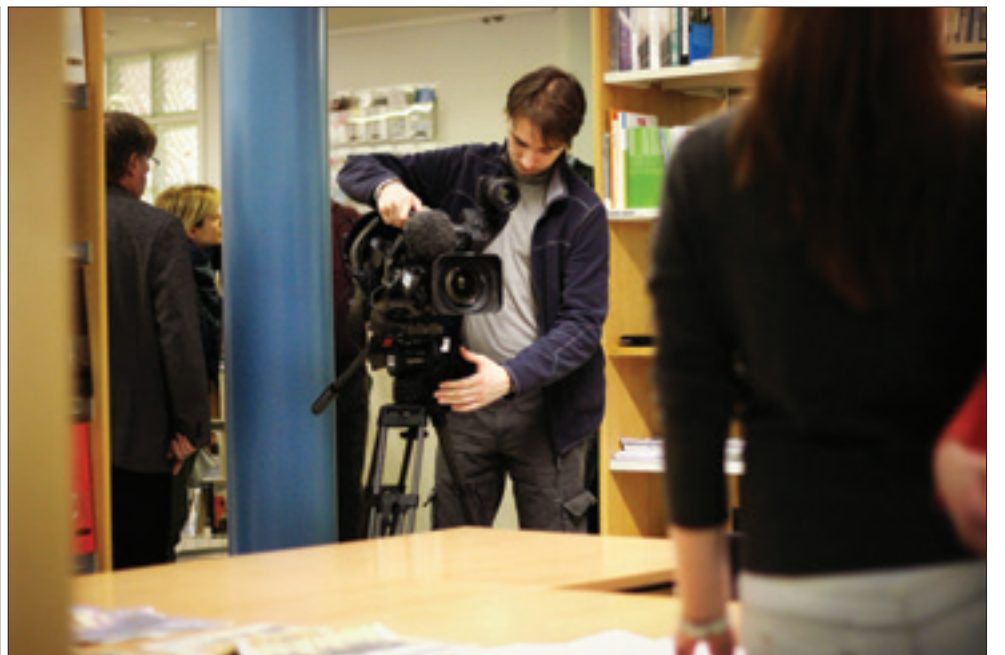
Venäjän televisiokanava 24 vieraili Pyhäjoen lukiolla keskiviikkona kuvaamassa materiaalia opiskelusta Pyhäjoen lukiosta. Oppilaat saivat olla mukana osallistumassa kuvauksiin.