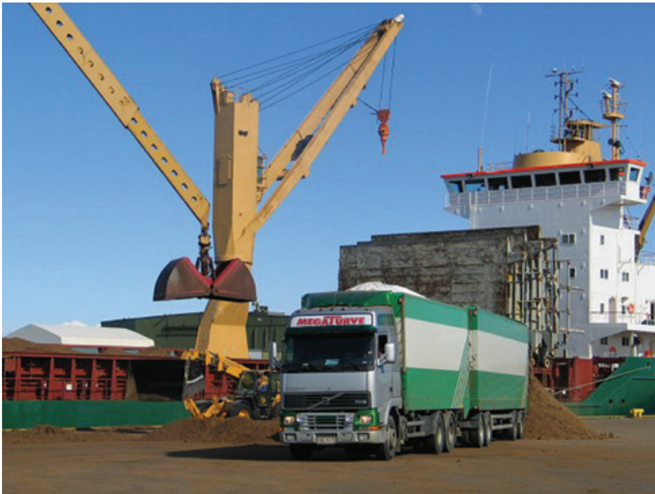
Kasvuturpeen lastausta laivaan Rahjan satamassa.

Vuonna 1997 yhtiön perustajat kävivät Hollannissa kasvuturvemessuilla. Silloin suomalaista turvetta pidettiin liian kalliina ja huonolaatuisena. Onneksi käsitys muuttui. Hyvän laadun ja toimitusvarmuuden takia yhtiö pystyy lisäämään suomalaisen turpeen vientiä Saksaan ja Hollannin kasvuturvemarkkinoille. Megaturve OY:n turpeen vienti ulkomaille alkoi onnekkaan sattuman johdosta. Vuosi 1998 oli hyvin sateinen ja huono turvekesä ympäri Eurooppaa. Kasvuturpeesta oli sen takia kova pula. "Tämän seurauksena saimme hollantilaiset tulemaan tutustumaan turpeeseemme. He havaitsivat laatumme hyväksi. Ensimmäisen turvelastin saavuttua perille he totesivat, että meihin voi luottaa turvetoimittajina." Siitä lähtien yhtiö on ollut sopimuksessa saman yrityksen kanssa. Yhtiö toimittaa myös turvesekoitteita piharakentamiseen sekä viherkentille.