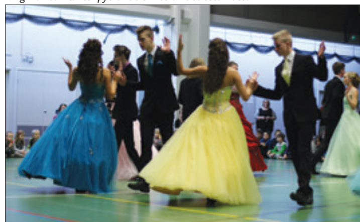
Yksi tansseista oli rennon letkeä Salty dog rag.