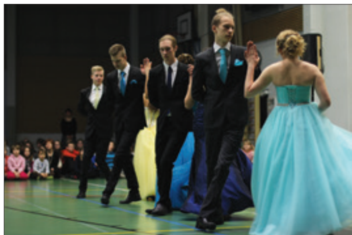
Virginia reel -tanssi pyörähdeltiin solamuodostelmassa.