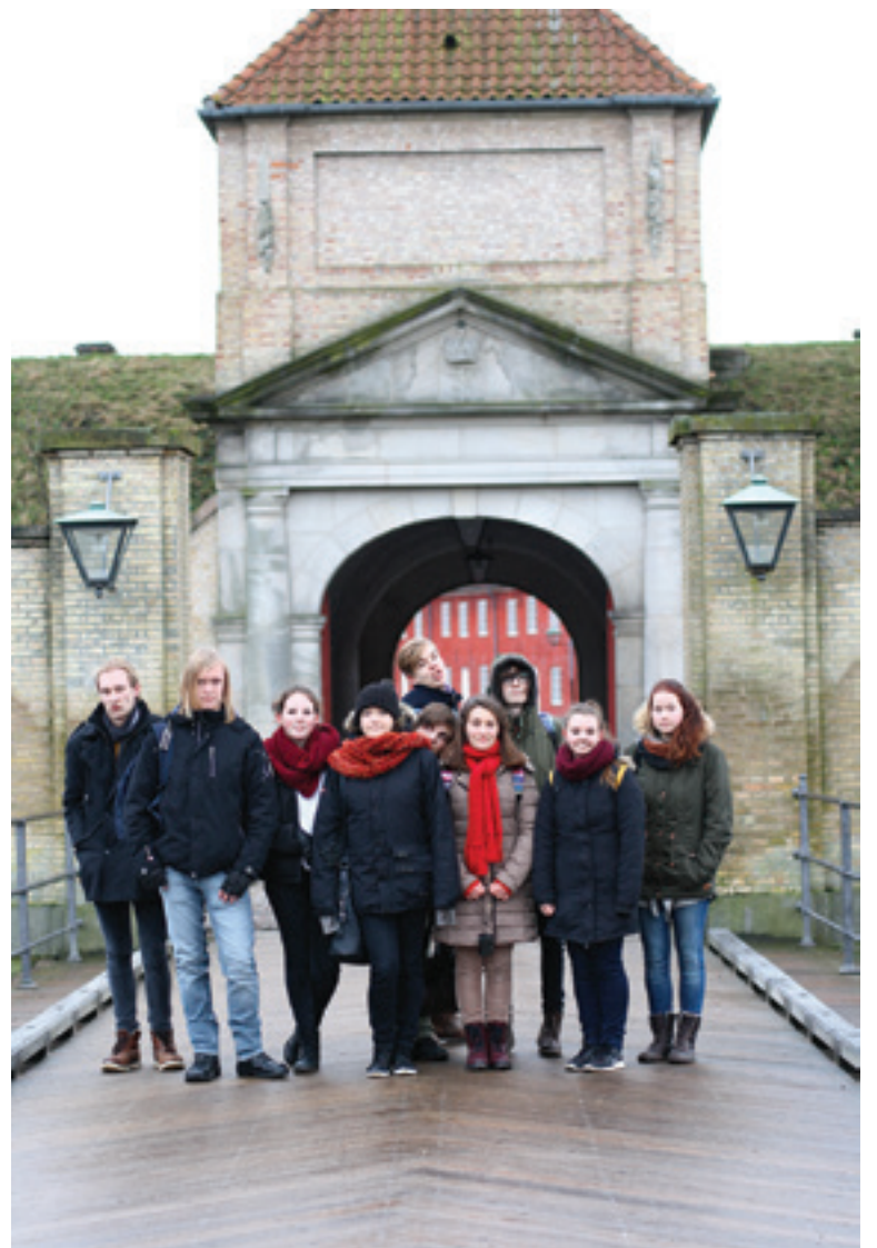
Osa projektiin osallistuneista oppilaista kävi vierailemassa Pieni merenneito-patsaan luona.

työskentelyryhmissä päästiin suunnittelemaan innovaatiota sekä brändäämistä. Projektivii- kon aikana osallistujilla oli myös mahdollisuus vieraila useissa museoissa ja kulttuurikohteissa, jotka liittyivät projektin teemaan edustamiensa aikakausien kautta.