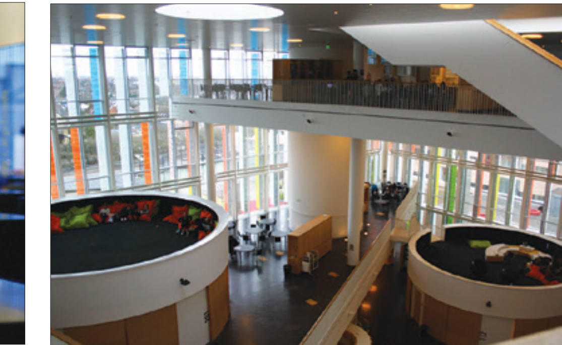
a. Ørestad gymnasium on moderni ja innovatiivinen tanskalainen koulu.