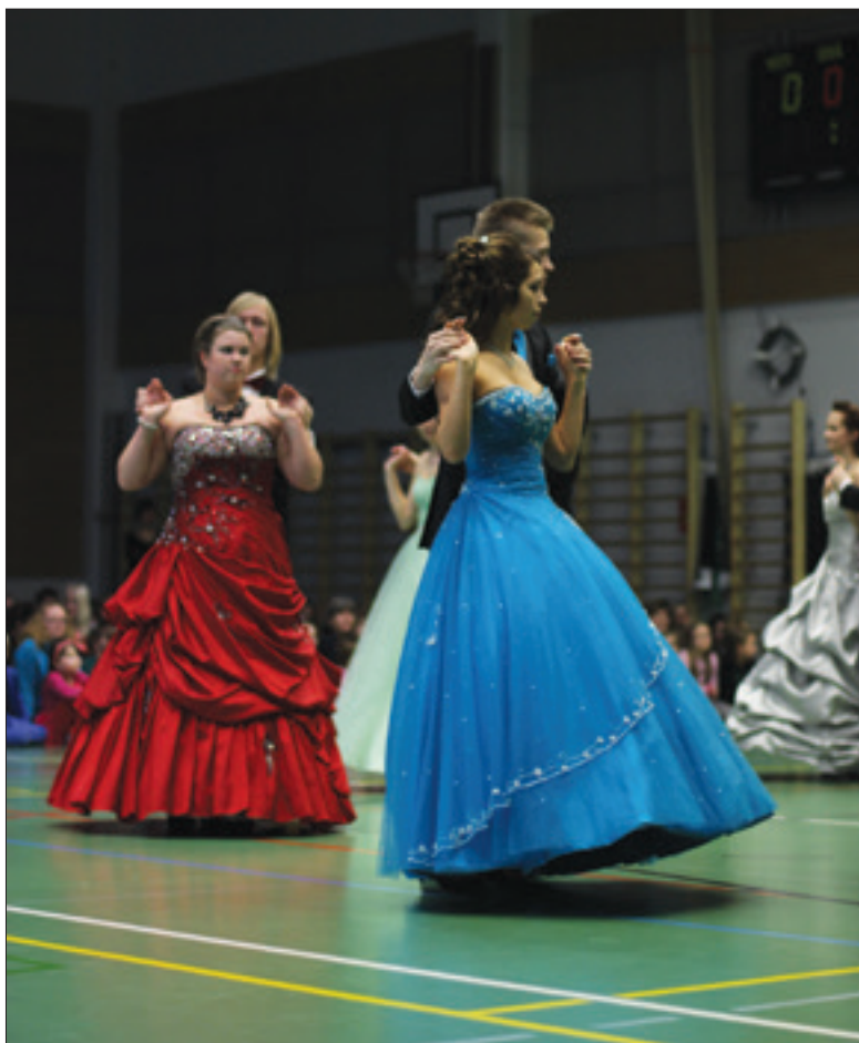
Wanhat tanssivat myös suosittua Cicapo- tanssia.